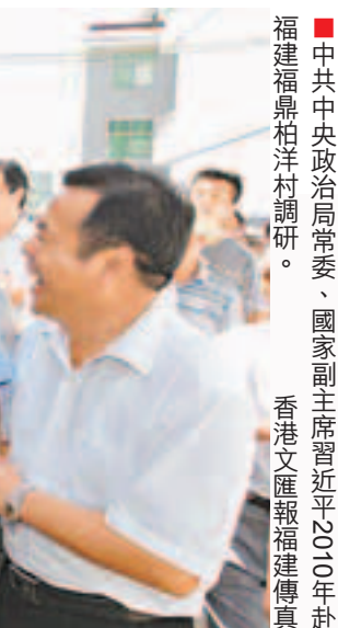
中共中央政治局常委、國家副主席習近平2010年赴福建福州柏洋村調研。

針對今年中央一號文件明確指出的繼續加大力度鼓勵和支持農民專業合作社的建設與發展，從今年起，福建省每年將安排不少於2,000萬元的專項扶持資金，擇優扶持100家省級示範合作社，加快推進合作社規範化建設。福建省政府日前還出台了《福建省「十二五」農民專業合作社組織發展專項規劃》，指出到2015年，農民專業合作社組織吸收和帶動農戶將達45%以上，全省農民專業合作社數量將達2萬家以上，全省60%以上農民專業合作社將實現規範化管理。