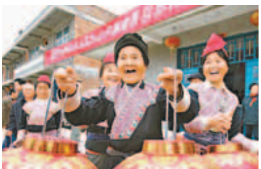
福建18戶畬族村民喜遷新居

與此同時，福建的集體林權制度改革、閩合農林合作、農村工作機制創新等工作也繼續走在內