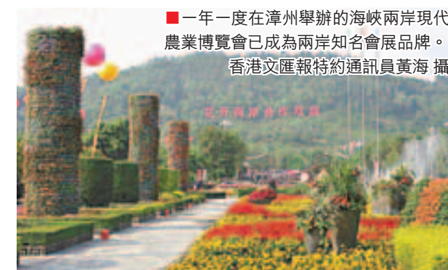
一年一度在漳州舉辦的海峡两岸現代農業博覽會已成為兩岸知名會展品牌。

同時，福建也將實施農業「五新」入戶工程，扶持10個農業「五新」集成推廣示範基地，建設100個重點示範項目，培育1萬個示範戶。推進鄉鎮「三農」服務中心建設，完善鄉鎮或區域性農業技術推廣、動物疫病防治、農產品質量安全監管等公共服務功能，加強鄉鎮或流域水利、基層農業公共服務機構建設。每年還將選派1,000名鄉鎮幹部農技人員到中等農業院校、科研院所繼續深造，就地培養農村實用人才帶頭人1.5萬名。