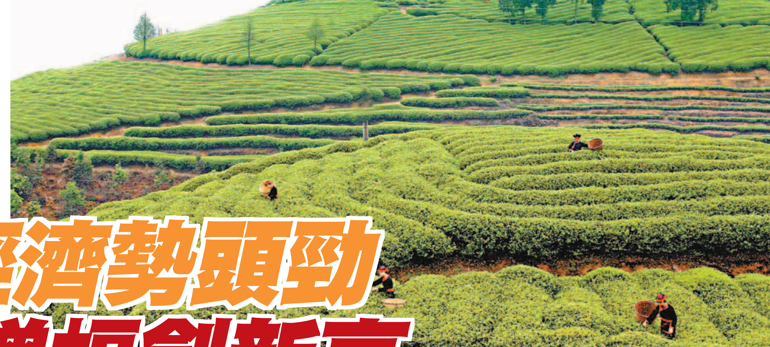
福建茶園滿山綠，茶產業帶動了當地農民致富。