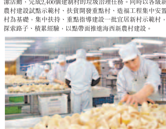
科技提升了福建農業核心競爭力。圖為福建明良公司產品遠銷歐美。