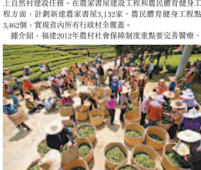
春茶收穫 香港文匯報福建傳真