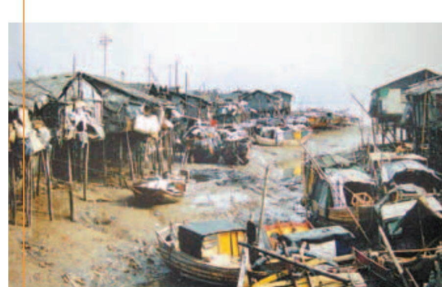
圖為昔日福建海上漁民生產生活的漁家船