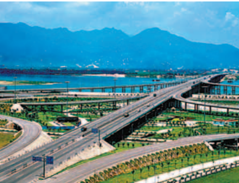
八閩高速，氣勢如虹。

此外，福建還將推動開通「小三通」廈金航線夜航，繼續保持先行先試優勢。據悉，目前廈金航線日運行36個航班，由於日間航班已經不能滿足需要，特別是往返台胞的出行需求，計劃在現行的廈門東渡至金門水頭碼頭航線增開夜間航班。