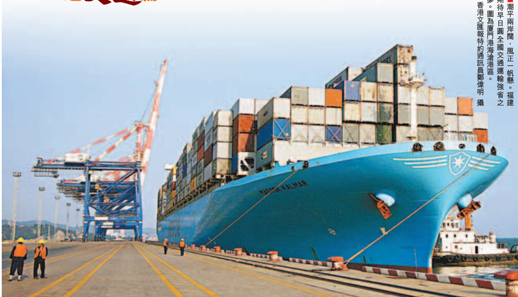
潮平兩岸闊，風正一帆懸。福建期待早日圓全國交通運輸強省之夢。圖為廈門港海滄港區。

「十二五」是福建科學發展跨越發展、開創海峽西岸經濟區建設新局面的關鍵時期。記者從福建省交通運輸廳獲悉，福建省交通運輸部門將按照省委省政府戰略部署，繼續大力推進大港口、大通道、大物流建設，2012年計劃完成投資800億元（人民幣，下同），加快建設全國交通運輸強省。