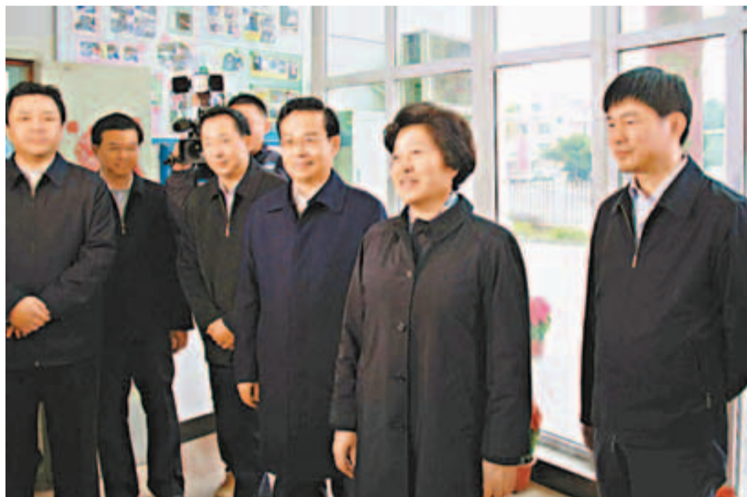
2012年1月福建省委書記孫春蘭（右二）、省長蘇樹林（右三）到福州公交動物園首末站看望慰問公交員工。

據了解，今年福建省將持續推進交通運輸惠民工程。啟動農村路網規劃調整，建成2,000公里，實施安保工程3,000公里，完成危橋改造100座和渡改橋5座，開工陸島碼頭15座、建成8座，更新改造渡口84道、渡船113艘，進一步改善農村交通條件；繼續實施村村通客車工程，推廣公司化、集約化經營，新增更新客車600輛，建成客運站20個、候車亭80個，讓農村客運開得起留得住；繼續優先發展公交，推動加快縣級交職能移交，新增更新車輛2,000輛、新增線路50條、延伸優化線路100條，力爭廈門列入國家「公交都市」示範工程試點城市；促進出租汽車行業健康發展。同時貫徹《公路安全保護條例》，實施國道205示範工程635公里、國省道安保工程3,000公里、災害防治500公里，建設國省幹線服務區5個、養護中心3個，打造一批綠色交通通道。