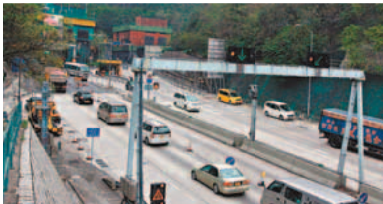
獅隧南行管道快線今早6時重開。 資料圖片

容建宜指出，日前的大火令獅子山隧道南行管道內的地下水管外牆，出現石屎剝落及鋼筋外露情況，由於快線只有4處地方受損，料將於今晨6時前完成復修，並重新開放。至於慢線方面，石屎剝落及鋼筋外露情況十分嚴重，且波及範圍長達60米，需要大批工程人員使用大量臨時支架進行24小時搶修，最高峰時多達60名工人同時工作。容建宜指出，由於獅子山隧道內，每60米才有一個僅能容納1名工人進出的沙井口通往地下水管，而今次慢線受損的60米範圍內卻沒有任何沙井口，故需在當中開鑿兩個6米乘2米的出入口，方便維修人員出入及工具進出，期望下周四(22日)前完成整項工程。