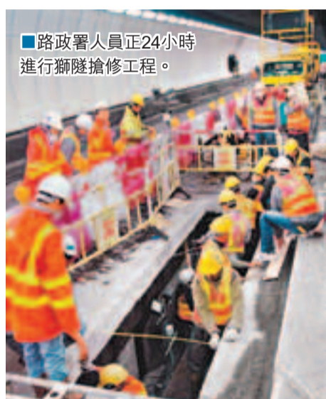
路政署人員正24小時進行獅隧搶修工程。

香港文匯報訊(記者 聶曉輝)獅子山隧道往九龍方向的南行管道日前發生一場大火，導致來往九龍及新界的交通秩序大亂，消防員灌救9小時才將火警救熄，南行管道需即時封閉搶修。運輸署指出，經多日搶修後，南行管道南行快線的復修工程將於今晨6時前完成，並於今晨6時起重開，慢線則繼續封閉。同時實施潮水式行車安排，包括早上繁忙時段2條管道合共開放3條行車線，以疏導車輛。路政署總工程師容建宜表示，由於維修工程旨在復修管道內損壞部分，故不會以更耐熱的防火物料復修。