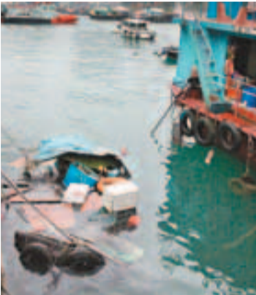
駁艇遭撞沉，僅篷頂露出水面。