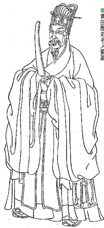
■青田歷史名人劉基

華僑文化帶動了青田的特色鄉土文化走向世界。國家級非物質文化遺產青田魚燈，歷史悠久，道具製作精美逼真，伴奏音樂鏗鏘有力，舞蹈動作粗獷奔放，表演風格熱烈樸素。據傳，魚燈是青田歷史名