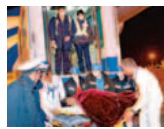
■一名躺在擔架上的傷員被抬下飛機。