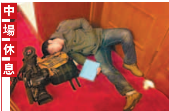
■由於在外圍等候時間過長，加之「兩會」以來的勞累，一名記者席地而睡。

三、進一步發揮民間力量，搭建學習、交流、互動平台，通過切實可行的具體舉措，推動新來港人士真正融入香港社會。鼓勵企業積極參與到新來港人士問題的解決，集全社會之力，幫助新來港人士；在政府扶持引導下，民間社團可發揮自身優勢，深入新來港人士家庭，解決實際困難，成為新來港人士融入社會的重要平台。 四、調動自身積極性，開展廣泛深入的輿論宣傳，引導新來港人士主動自我提升，共創美好未來。