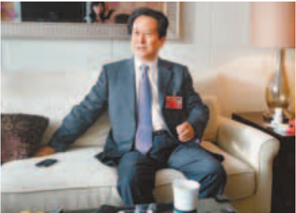
■全國政協委員、香港中國商會主席陳經緯籲內企「借港出海」。

香港文匯報訊（兩會報道組 張一波）全國政協委員、香港中國商會主席陳經緯昨天在接受記者採訪時說，經過30多年改革開放，內地已湧現出一大批具備雄厚資金的企業，但全球資源充足和內地經濟減速卻讓企業進一步發展遭遇市場、資源等瓶頸問題，因此讓符合條件的內地企業「走出去」才是歷史趨勢。