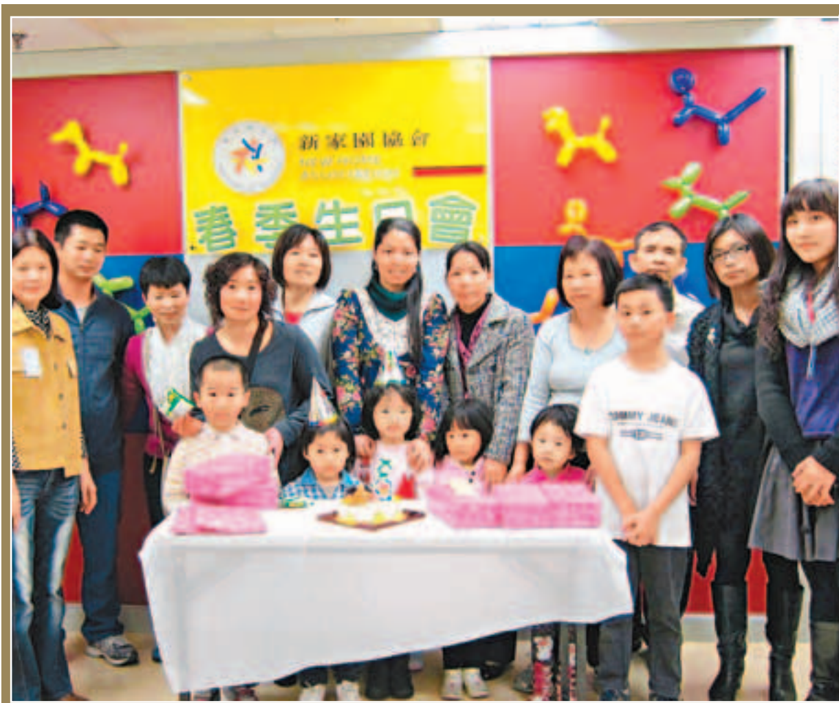
■世貿集團董事局主席許榮茂等成立「新家園協會」，為新來港人士提供跨境一站式服務。並設立「新家園世茂助學金計劃」，減輕新來港家庭中子女開學期間的經濟壓力。 資料圖片