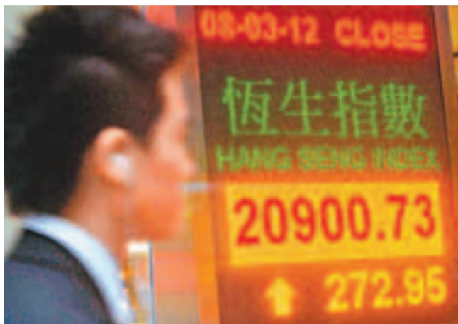
恒指高開後升幅擴大，並一舉升穿250天牛熊分界線，收升273點，成交額647億元。

接受自願換債的匯控(0005)微跌0.07%，但中資金融股領漲，平保(2318)和太平(0966)升約5%，長和系在業績前