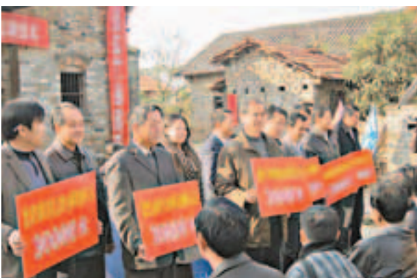
■社會各界踴躍捐資支持水利事業

未來一段時期，江夏區將進一步加強水利標準化建設力度，並投入專項資金3億元。除繼續建立健全和完善長效管護機制，確保全區所有塘堰和溝渠用得久、受益長外，還將着力推進南部鄉鎮旱地地區為重點區域的綜合信息整治工程，加快實施陽武幹渠渠道清淤護砌引水工程、金水河流域綜合整治工程、青龍嘴等七座小二型病險水庫除險改造工程和六合灌區連建配套工程建設，不斷改善農業農村生產生活條件。新一輪「三萬」活動在社會、經濟、政治等方面所取得的效益，將助推江夏區「十二五」時期的三農工作，成為全省的「農業現代化」示範標兵。