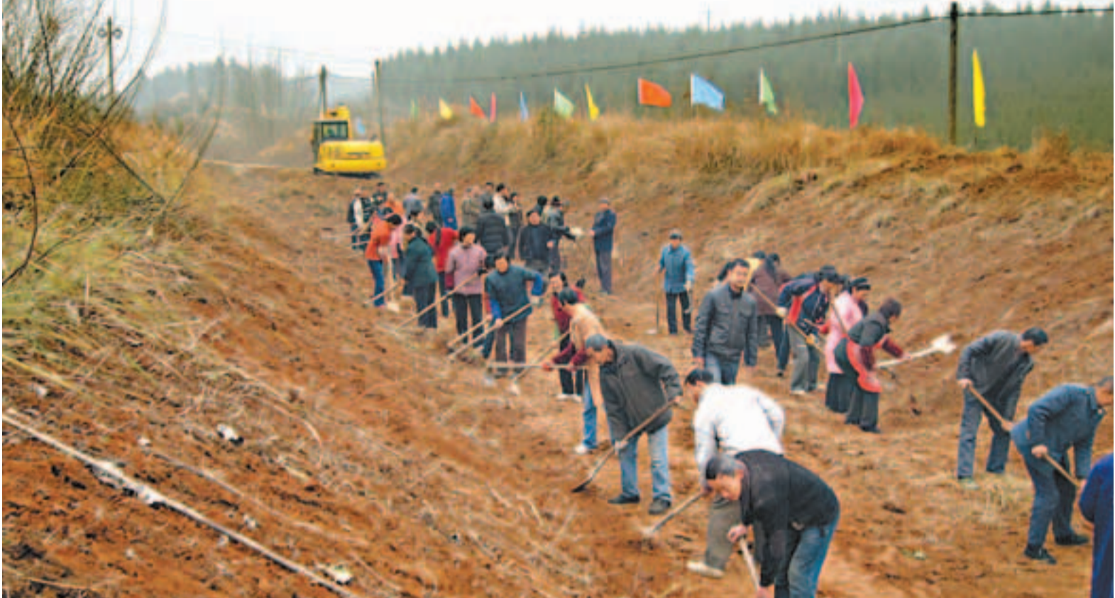
■幹群齊上陣疏通渠道