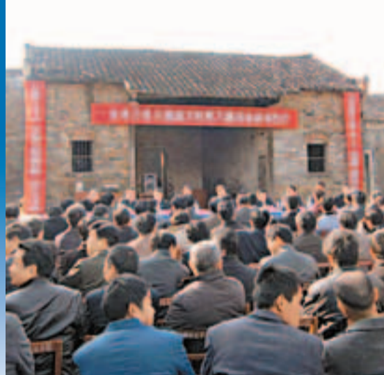
■武漢市「三萬」活動在江夏區山坡街啟動

江夏區採取「五統一」模式加快工程施工進度，即「統一規劃設計、統一合同格式、統一工程價格、統一工程驗收、統一結算方式」。在工程管理中，則實行「四個一」制度，即「一個整治方案、一張工程進度表、一名責任人、一名技術服務人員」來確保工程施工質量。