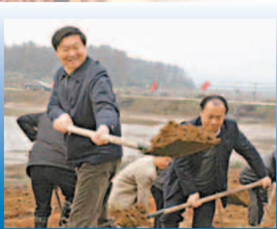
■江夏區委書記汪祥旺（左）帶領機關幹部到所駐村參加勞動