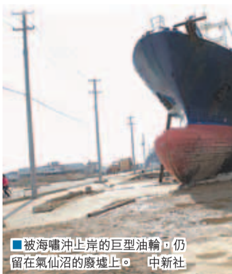
被海嘯沖上岸的巨型油輪,仍留在氣仙沼的廢墟上。