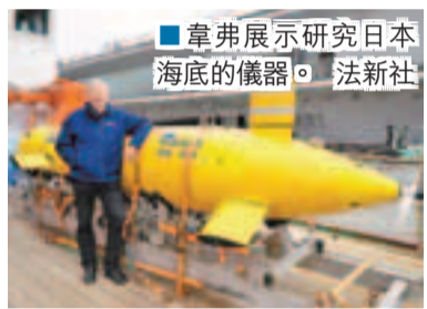
韋弗展示研究日本海底的儀器。

日本及德國的研究人員昨日出動高科技儀器,深入7公里的海床,了解去年大地震對海床帶來的影響。