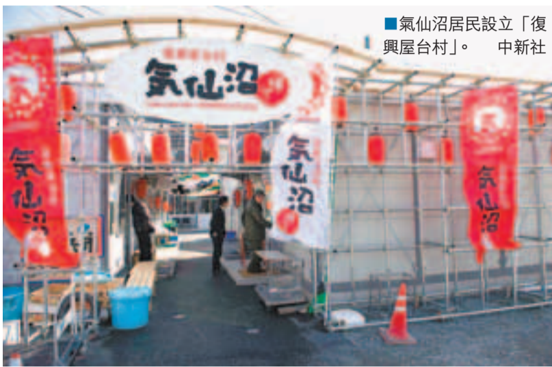
氣仙沼居民設立「復興屋台村」。