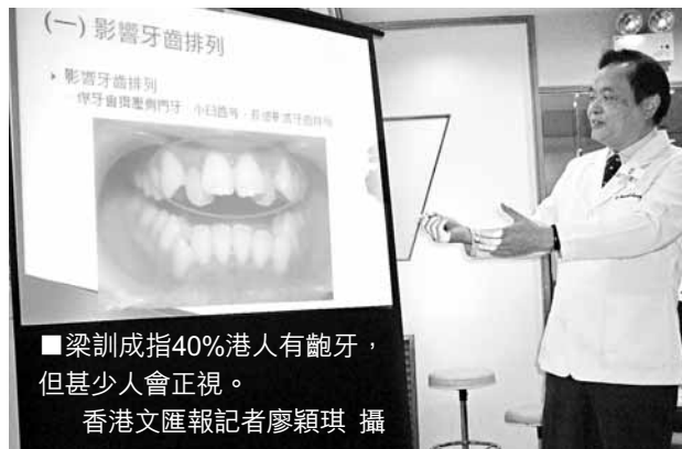
香港文匯報訊(記者 廖穎琪) 香港平均每10人便有4人有「龅牙」，情況很普遍，但甚少受人正視。有牙醫指出，忽視問題不但導致口腔問題...