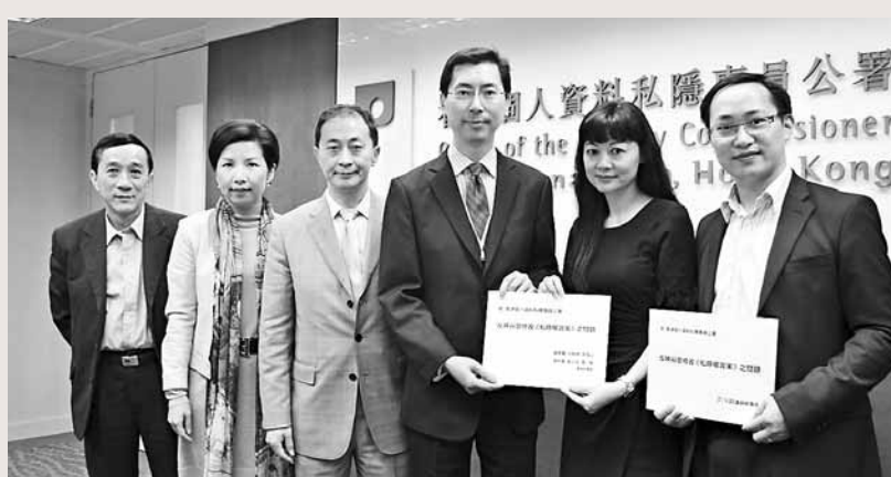
新論壇廳愛蘭一行約見私隱署，促跟進網絡供應商套取用戶私隱資料的問題。