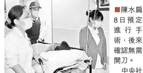
陳水扁8日預定進行手術，後來確認無需開刀。

香港文匯報訊 綜合消息：台灣前領導人陳水扁7日入院檢查發現冠心病，原定8日進行手術，但早上手術前的心血管攝影，發現他無需開刀，只要利用藥物治療即可。8日有媒體引述消息指，阿扁7日還被安排前往精神科與醫生會面，懷疑其患有精神疾病；不過院方及扁子陳致中8日先後否認阿扁有精神問題。