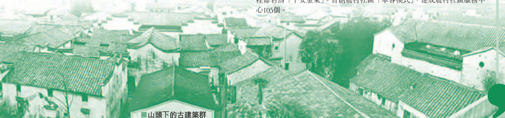
■山頭下的古建築群