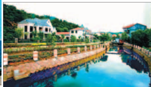
■美麗鄉村 澧浦鎮長庚村