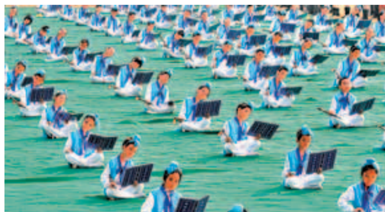
■書法操糅合了武術、書法和拉丁舞，展示了澧小的特色。

民生事業成效顯著。為省級教育強區，城鄉居民社會養老保險制度實現全覆蓋，人口和計劃生育工作被評為全國優質服務先進區，連續七年被省裡命名為「平安金東」。首創農村社區「車客模式」，建成農村社區服務中心105個。