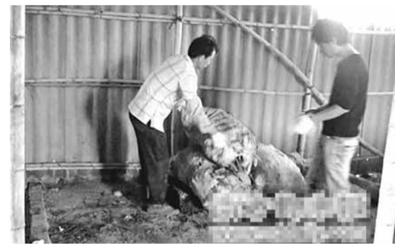
簡陋的設備，生產出大量「毒豬皮」。網上圖片

香港文匯報訊 據《南方都市報》報道，都說豬皮吃了能養顏，可如果您知道正在吃的豬皮是用塑膠熬製的，相信很多人都會覺得噁心。記者7日從東莞高埗鎮獲悉，經過高埗城市管理綜合執法分局連日來的調查摸底，突擊取締了匿藏在村內的一個非法加工豬皮的窩點，現場銷毀了成品豬皮600餘斤，並對石棉瓦搭建成的工場進行了拆除，其中熬製豬皮的竟是塑膠等有毒物質。