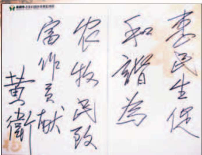
▲自治區黨委、自治區常務副主委黃衛為農村信用社題詞「惠民生促和諧為農牧民致富作貢獻」

近期，中國銀行業監督管理委員會對2011年全國35家農村合作金融機構主要經營及風險指標進行了排名，新疆農村信用社主要業務經營指標躋身前列。其中，資本充足率12.3%，居第十二位；撥備覆蓋率居第九位；不良貸款率居第五位；貸款損失專項準備充足率居第六位；貸款損失專項準備金缺口居第七位；資產利潤率居第四位；成本收入比居第八位。