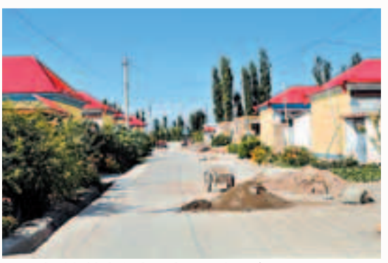
▲霍城縣良繁中心富民安居工程一角

喀什地區富民安居工程共有17萬戶農戶住宅需要改造，由於當地農戶收入普遍偏低，自籌資金難一直是建房安居的最大障礙。2010年4月，本着「改造與新建並舉、扶持與自籌結合、專款專項管理」的原則，農信社貸款17億支持喀什地區富民安居工程建設，從2010年至2013年3年完成，平均向每戶農戶發放貸款4萬元，授信額度適度增加，農戶最高授信額度可達5萬元，貸款期限適當延長，貸款利率適度下浮，貸款手續進一步簡化，同時對農戶「兩貸」貸款關閉供應，既要「安居」又要「富民」，防止增加負債返貧的現象發生，千方百計幫助喀什地區農牧民住上安居房，把這項「功在當代，利在千秋」的民生工程做好。2011年以來，全區農村信用社堅定不移地貫徹落實民生優先的信貨政策，在加大對「三農」、「三牧」信貸投入的同時，切實加大安居富民、定居興牧工程的信貸投放。截至2011年末，農村信用社兩居貸款餘額達36.7億元，惠及16.8萬戶農牧民。一方面，新疆農村信用社加強與地方各級黨政和職能部門的協調與溝通，充分掌握「兩居」工程建設目標、財政補貼和對口撥款資金情況，根據政府制定的工程建設方案，準確測算資金需求規模，積極籌措資金，確保資金供給及時足額到位。另一方面，在宏觀調控政策趨緊、信貸規模緊縮的情況下，準確掌握全區「兩居」工程信貸資金需求，向人民銀行進行申請新增50億元信貸額度，合理分