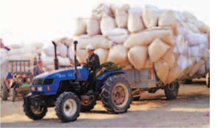
▲在庫爾勒市農村信用合作社支持下的棉農喜獲豐收