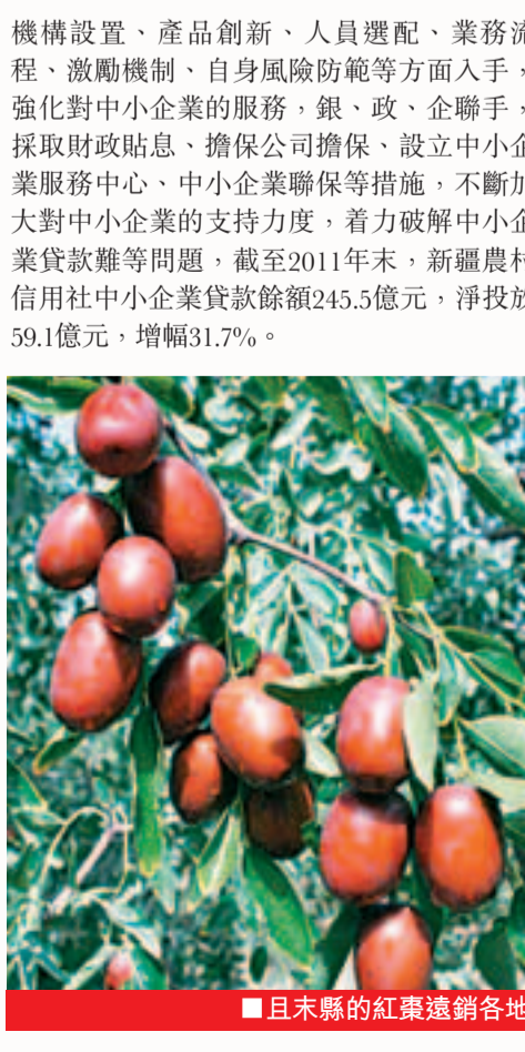
▲且末縣的紅棗遠銷各地