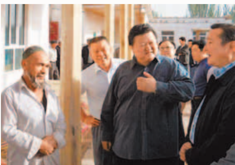
▲自治區人大常務會副主任、自治區金融辦黨組書記、自治區農村信用社聯合社黨委書記王會民一行在喀什地區考察農村信用社支持農民安居工程工作。