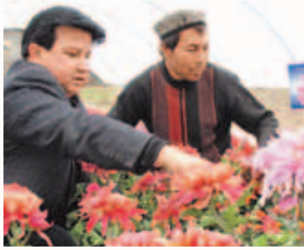
▲伊犁州伊寧縣農村信用社助農增收

2012年仍然是新疆「民生建設年」，新疆農信社將繼續以服務三農、服務中小企業、服務縣域經濟為己任，積極創造條件，充分發揮資源配置作用，努力把社會、公眾的關注點轉化為自身可持續發展的增長點，為把民生領域從經濟社會發展的薄弱環節變成經濟社會發展的推動力貢獻更大的力量。