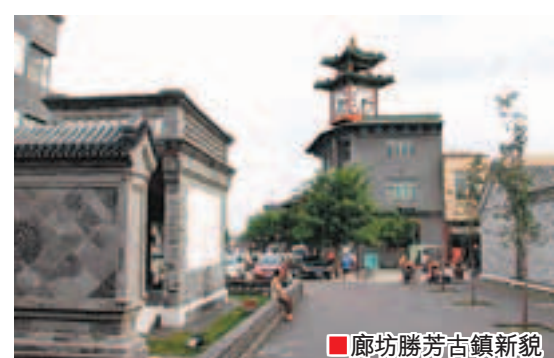
廊坊勝芳古鎮新貌

面積：6429平方公里 人口：430萬 2011年GDP總量：1650億元 2011年GDP增速：11.5% 2011年進出口總值：52.9億美元 2012年重點發展產業：電子信息、裝備製造、清潔能源、生物醫藥、新材料、節能環保等。