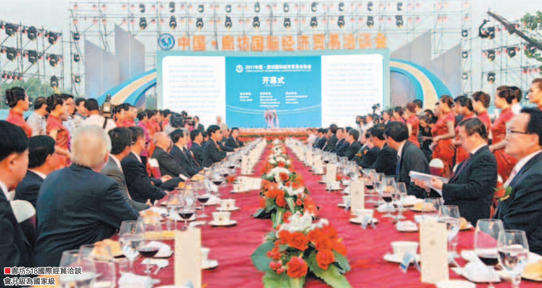
廊坊518國際經貿洽談會升級為國家級