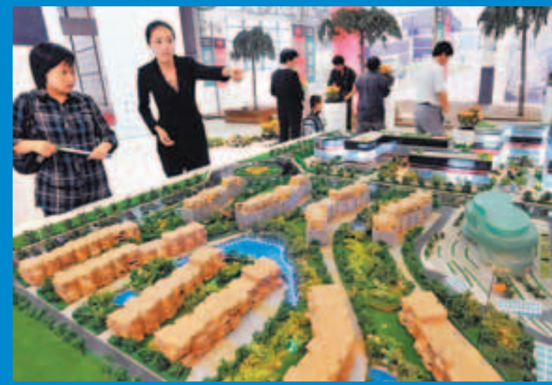
在廊坊舉辦的河北省城博會展示城建新理念

在會展行業發展上，圓滿完成了「5·18」經貿會務組織、客戶邀請以及APEC高層會議等專項活動承辦工作，廊坊共簽約外資項目14項，總投資26億美元，簽約內資項目208項，總投資1300億元。在園區建設上，積極推動河北廊坊津港經濟開發區、河北文安經濟開發區、河北三河經濟開發區、河北固安溫泉產業園區被河北省政府批准為省級經濟開發區，使該市省級以上園區數量繼續保持全省第一。在外經工作上，全年新批外資項目20個，有20家外企增資擴股；實施「走出去」戰略，新批境外投資企業9家，中方投資2.12億美元，居全省第一。