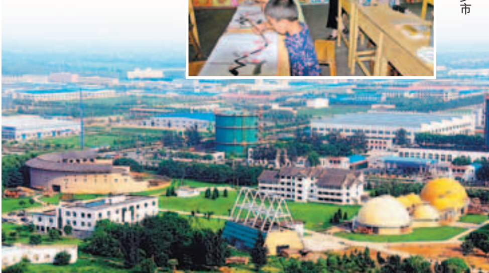
廊坊經濟技術開發區

今年廊坊市級財政安排民生方面支出26.3億元，同比增長27.1%。圍繞醫、食、住、行等群眾關心的熱點難點問題，集中力量抓好住房保障工程、飲水安全工程、教育提升工程、衛生強基工程、公交改造工程、全民社保工程、就業促進工程、文體惠民工程、十小便民工程、食品藥品安全工程等十項民生工程。