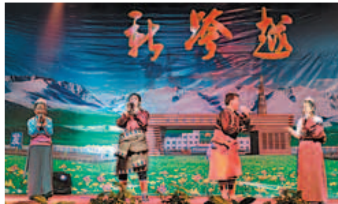
義海公司舉辦文藝晚會，藏族員工獻上精彩的節目。

三流企業靠經驗，二流企業靠制度，一流企業靠文化。義海公司正在憑藉著強大的資金技術硬實力和雄厚的「三原文化」軟實力向既定宏偉的目標大步邁進。