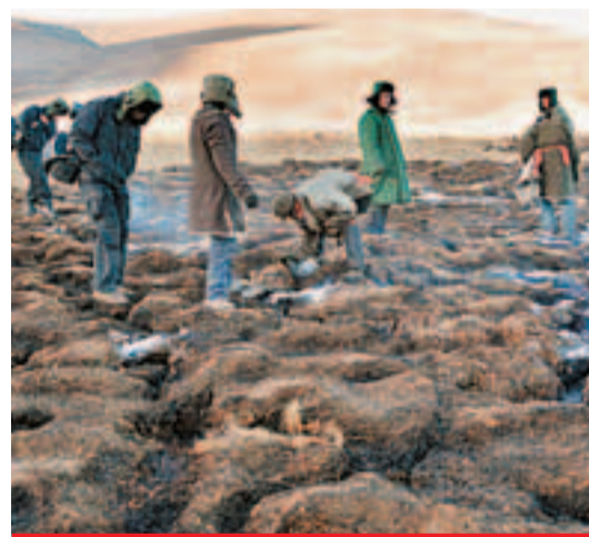
義海公司職工幫助牧民撲滅草場大火。