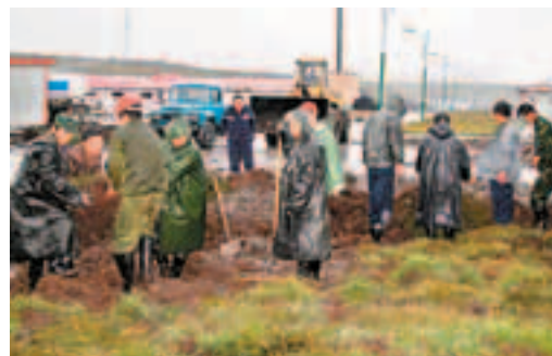
木里煤礦職工在礦區種植草皮。

持之以恆轉生態建設為義海公司贏得了「青海省節能減排先進單位」和「全國節能減排領軍企業」榮譽稱號。