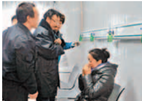
義海公司木里煤礦中的「高原氧吧」。

義海公司廣大幹部職工懷著「扎根海西、回報青海」和「缺氧不缺志氣，敢與高原比高低」的信念，發揮「特別能吃苦、特別能忍耐、特別能戰鬥、特別能奉獻、特別能進取」的精神，經過艱苦創業，已經由開始註冊資金943萬元的小企業發展到資產總額20億元現代化大型企業。