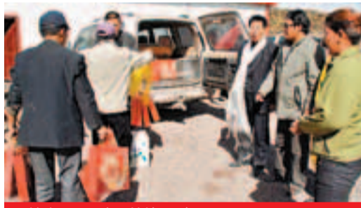
義海公司慰問藏族同胞。