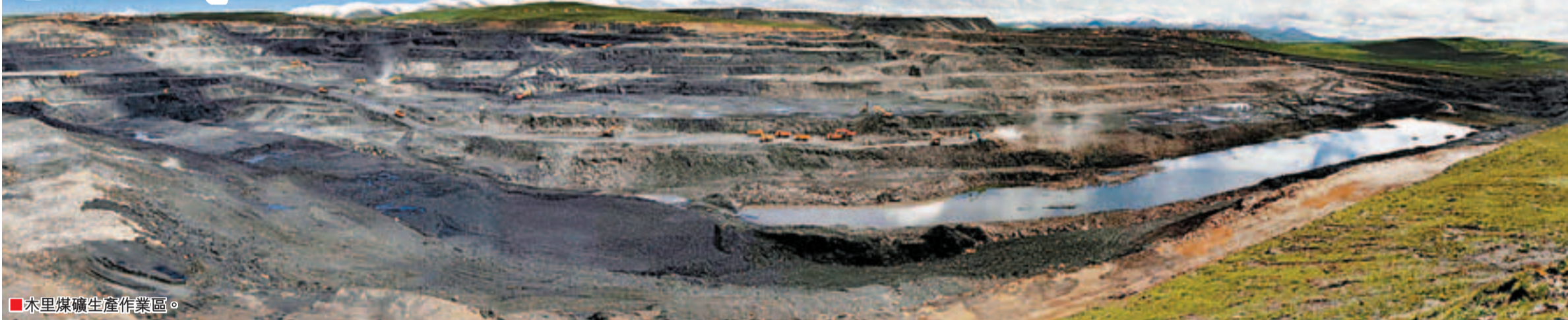
木里煤礦生產作業區。

2003年6月，為響應國家西部大開發的號召，河南省義馬煤業股份公司在青海省組建了國有獨資公司——義煤集團青海義海能源有限責任公司（以下簡稱義海公司）。公司總部位於青海省海西州蒙古族藏族自治州府所在地德令哈市，下轄兩座露天礦和一座井工礦，分別地處於天峻縣境內的木里煤田和大柴旦行政區境內的大煤溝煤田，主要生產優質煉焦配煤和良好動力煤、民用煤。僅在礦區就業的員工就有2,600餘人。