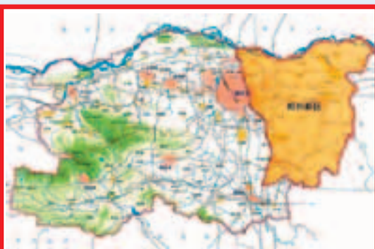
■「兩核六城十組團」格局圖