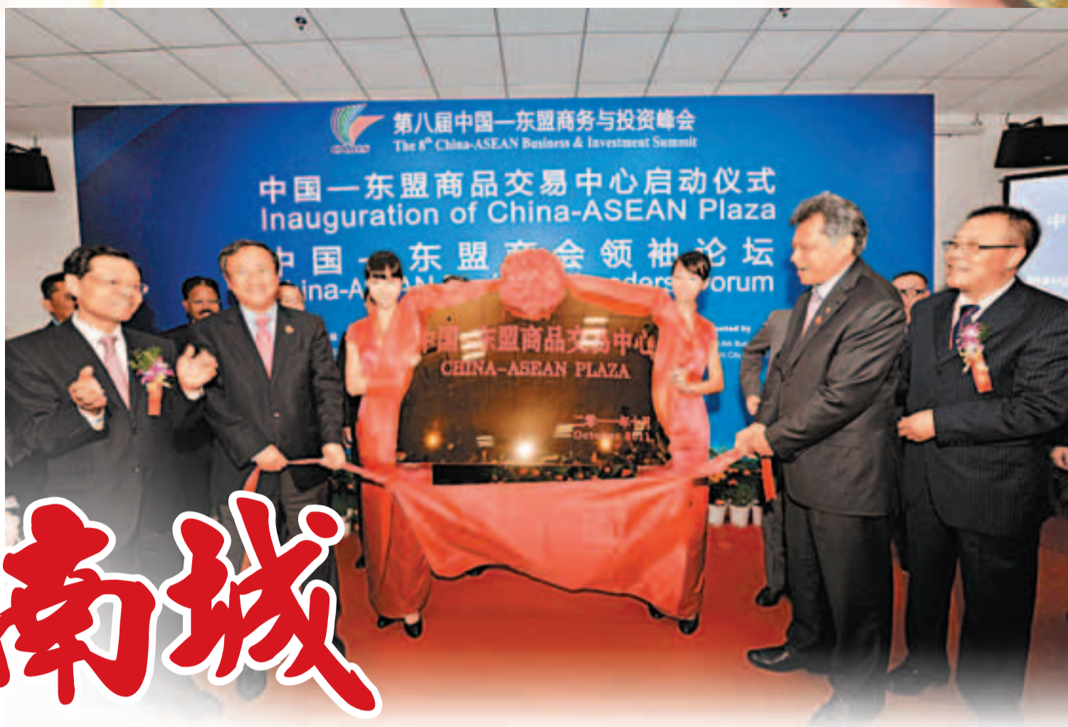
南寧華南城——中國-東盟商品交易中心揭牌儀式

2011年10月21日和11月18日，國務院總理溫家寶分別在第八屆中國-東盟商務與投資峰會開幕式和第十四次中國-東盟領導人會議上兩次提出「在南寧建設中國-東盟商品交易中心，作為雙方產品的展示交易平台和商貿物流基地」。同期，「中國-東盟商品交易中心」在南寧華南城隆重揭牌。12月12日，廣西壯族自治區發改委、中國-東盟商務與投資峰會秘書處、南寧市政府等十幾個相關職能部門表示將大力支持中國-東盟商品交易中心的建設和發展。地處廣西首府的南寧華南城高度契合國家政策精神，成為中國與東盟經貿交流的最佳平台。■香港文匯報記者 孫雪、通訊員 王璇