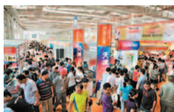
第八屆中國東盟博覽會——南寧華南城東盟專區人頭攢動

代表團相繼與印尼工商會、印尼中華總商會、印中商務理事會、印-中中小企業商會、泰國廣西總會等諸多機構和社團簽署戰略合作框架協定。在中國-東盟產品交易中心介紹會上，華南城方面表示，願意為東盟各國劃出5萬平方米的商品展示交易專區。此外，總建築面積達48萬平方米的東盟特色小商品展示交易市場正在推進建設，預計於今年內建成並交付使用。南寧華南城還定期舉辦面向國內外的專業產品展會，「以專業市場加會展」的模式，為東盟各國搭建優質的貿易平台、共同打造東盟財富新高度。