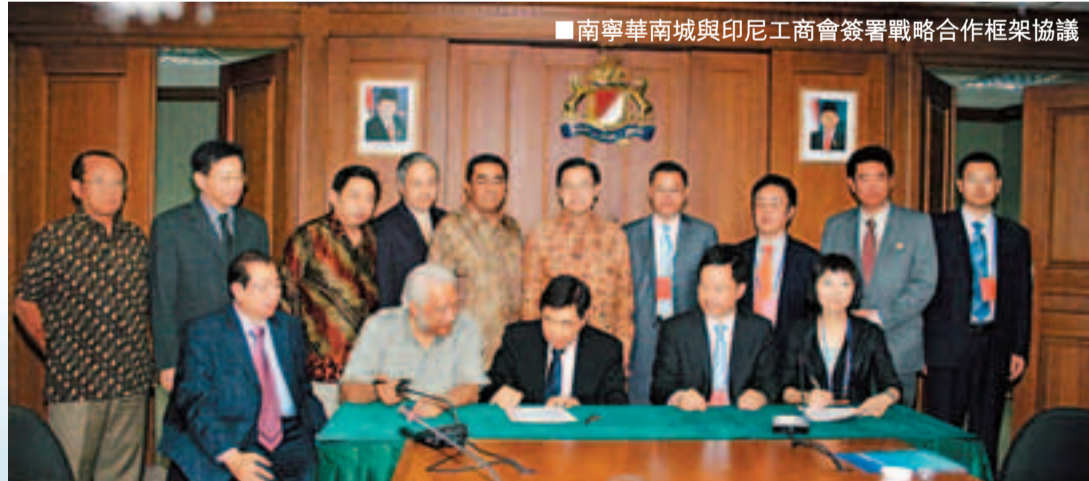
南寧華南城與印尼工商會簽署戰略合作框架協議

在提升會展經濟的同時，華南城首創的集成式商貿物流服務還可以通過整合城市群落的商品流、資金流、人才流、信息流，配套完善的現代商務、會展、電子商務體系，有效促進傳統物流模式轉變、提高城市和城際配送效率，使製造業、商貿流通企業可以輕鬆地實現一站式採購和物流配送服務，降低了企業採購成本和交易成本，降低了生產企業的庫存以及資金成本和經營風險，提高企業市場反應能力和創新能力，提升整個產業和地區競爭能力的作。南寧華南城建成後，將吸引各類知名企業高密度聚集，成為東盟各國商品展示交易的優質平台，也將是「中國品牌」挺進東盟的絕佳跳板。