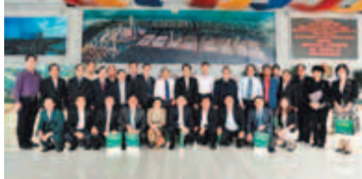
2011年11月18日，老撾中央委員、投資和計劃部張宋迪、隆迪一行到南寧華南城考察

結合。南寧華南城之所以如此受到國家和地方政商界人士青睞，主要原因在於其是順應國家區域經濟發展趨勢，順應國情、民生需求的產物，而且憑借集成服務模式等綜合競爭優勢，能夠擔當中國與東盟商品交易中樞的重任。