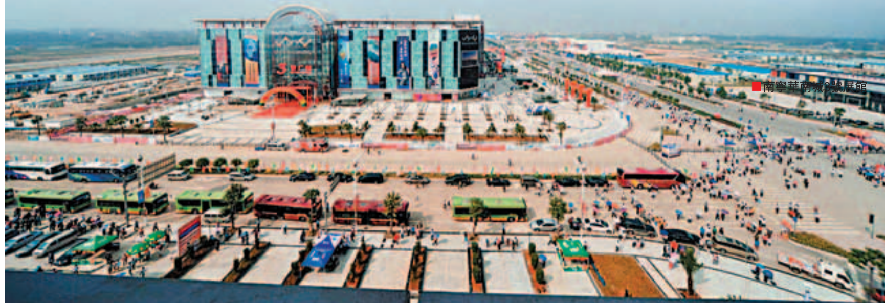
南寧華南城展覽館