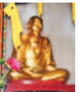
香港文匯報訊(記者 蘇榕蓉 莆田報導)一尊由唐代流傳下來的僧人真身肉像(見圖)供奉在千年古剎福建莆田龜山寺中,近日才被當地市民所了解,也令這座古寺聲名大噪。據了解,目前內地只有3尊唐代真身像,除了福建莆田,僅在陝西和廣東各發現一尊。

此後的80年代,莆田南山廣化寺再度重建。就在廣化寺重塑全寺佛像之際,亦替龜山寺重塑一尊全身遺骨、牙齒俱全的真身像。寶像塑成後,重新供奉在龜山寺法堂。