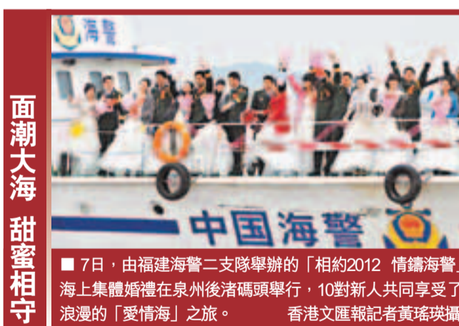
面潮大海 甜蜜相守

動力的節能環保汽車是本屆展會的一大特點,多家參展企業將集中展示20餘款新能源、新動力汽車。另外,濃厚的汽車文化氛圍是本屆車展的另一個特點,「百年國際經典老爺車展區」將展示38輛各類名車、老爺車以及歷史上名人、明星使用過的名牌汽車。