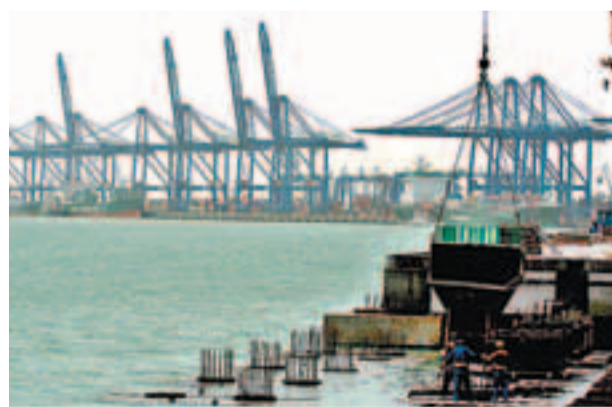
濱海新區東疆保稅港區。

香港文匯報訊 天津濱海新區涉外經濟體制改革正在逐漸推進。3月4日記者從東疆保稅港區獲悉,截至去年底,東疆對註冊在區域內從事國際航運、物流、倉儲業務的企業啟動營業稅免徵政策後,已完成對31家企業的減免稅審批,減免營業稅及附加費2,431萬元人民幣,使得相關企業減輕了稅費負擔,逐漸與國際接軌。