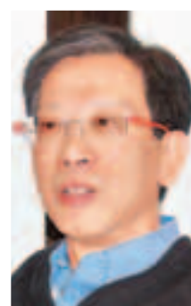
全國政協委員、基本法研究中心主席胡漢清：行政措施只能把關，治標不治本。

是次會議主題為討論「雙非」孕婦問題，各人代和政協和王光亞交換意見，讓中央了解情況，以推行確實對策。除王光亞外，出席會議的包括人大常委會法工委副主任李飛，以及公安部出入境管理局和計劃生育辦公室高層人員。與會者在會上提出多種解決辦法，包括行政措施、釋法、修法和修改香港的本地法例等。