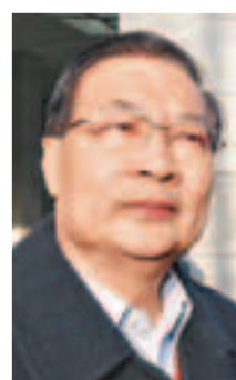
全國政協委員、民建聯主席譚耀宗：特區政府應盡快採取行政措施，內地出入境部門也可協助堵截「雙非」孕婦，及可在適當時候釋法。