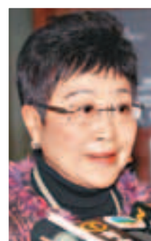
港區全國人大代表、香港自由黨主席劉健儀：會上意見傾向認為行政措施不能根治雙非孕婦問題，始終要透過法律層面解決。