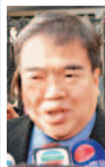
全國政協委員、醫院管理局主席胡定旭：公院應先照顧本地孕婦，雙非孕婦已衝擊急症室服務，引述王光亞指會和廣東有關方面配合處理問題。