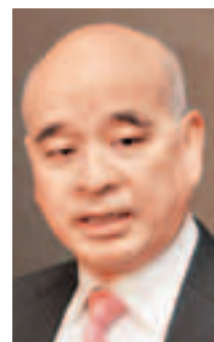
全國政協常委、新世界主席鄭家純：「雙非」問題是城市與城市的利益問題，各方應以包融和諒解的態度面對。