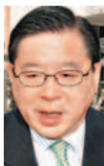
全國政協委員、經濟動力召集人林健鋒：修法耗時太久，應盡快釋法。