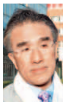
全國政協委員、新民主黨副主席田北辰：憑醫療簽注才可來港產子，嬰兒可獲居港權，否則負刑責。