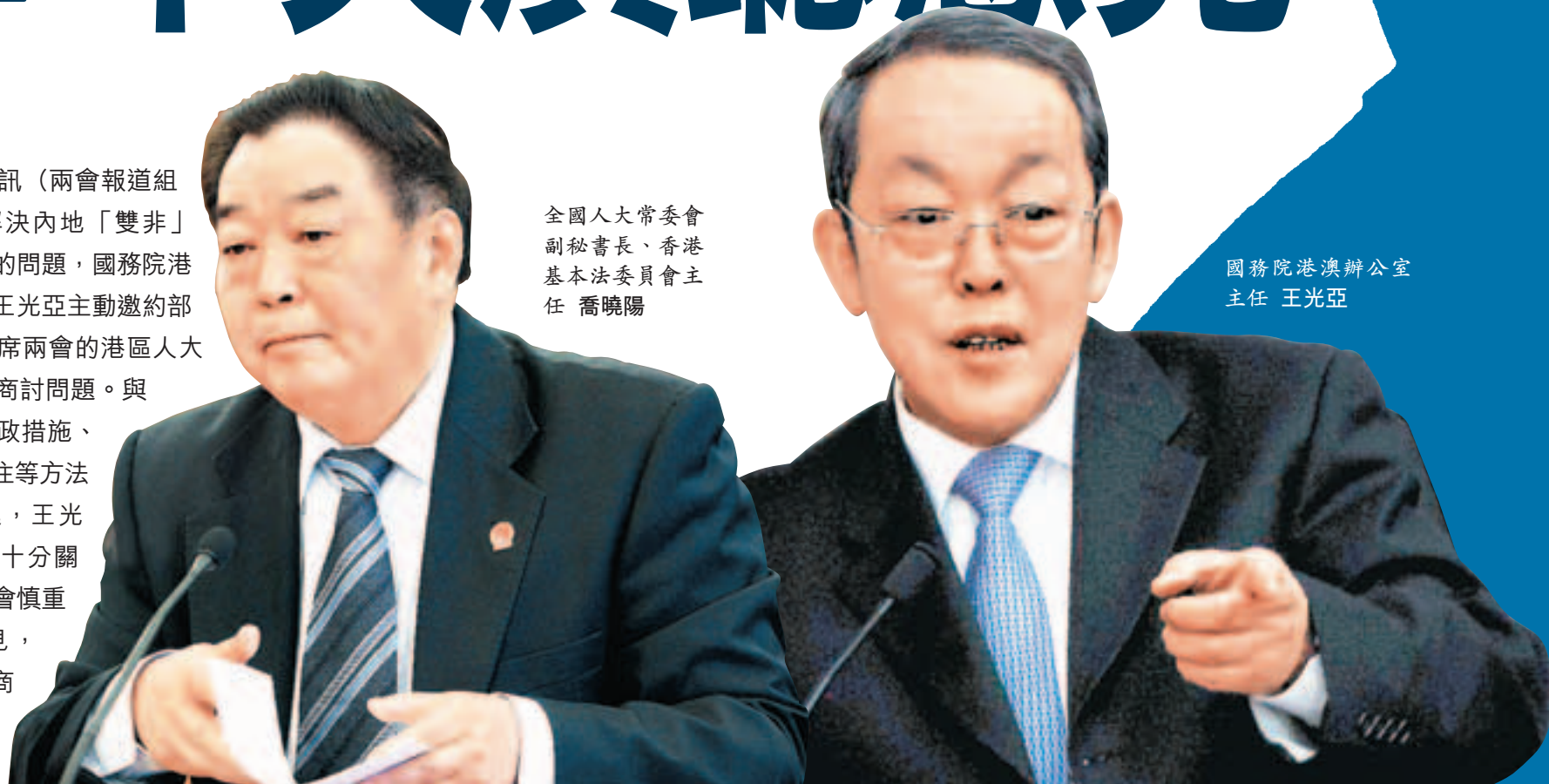
全國人大常委會副秘書長、香港基本法委員會主任 喬曉陽

香港文匯報訊（兩會報道組黃偉漢）就解決內地「雙非」孕婦湧港產子問題，國務院港澳辦公室主任王光亞主動邀約部分正在北京出席兩會的港區人大代表政協委員商討問題。與會者建議以行政措施、釋法和醫療簽注等方法應對。據引述，王光亞表明，中央十分關注有關問題，會慎重考慮大家意見，並與特區政府商討對策。