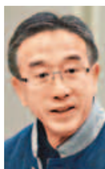
全國政協委員、自由黨榮譽主席田北俊：為「雙非」嬰兒簽發不標示居港權出世紙，如有異議循法律途徑處理，讓特區終審法院能自我糾正。