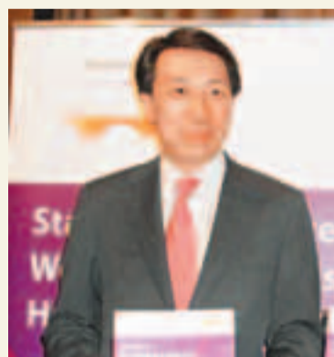
渣打銀行行政總裁洪丕正昨日出席一活動後表示,認為內地將今年經濟增長目標訂在7.5%是合理、保守的水平,因貿易增長自去年第四季開始放緩,相信今年上半年困難仍在,屬預料中事,料最快於下半年經濟增長才會加快。

洪丕正指,該行維持內地經濟增長8%及本港經濟增長2.9%的預測,並指內地可透過加息、存款準備金率及放貸總額等放鬆手段,刺激經濟增長,不過過分催谷會有後遺症,通脹便是其一,加上歐債問題解決需時,相信中央會以循序漸進方式來慢慢放鬆。