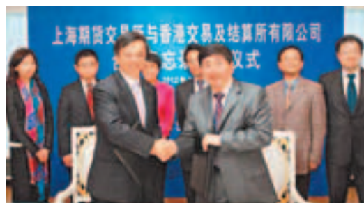
港交所行政總裁李小加(左)與上海期貨交易所總經理楊邁軍(右)於雙方簽署合作備忘錄後合照。

香港文匯報訊(記者 周紹基)港交所(0388)宣布與上海期貨交易所簽訂互換合作及資訊互換備忘錄。港交所行政總裁李小加表示,中國在全球商品市場的影響力與日俱增,香港作為領先的離岸人民幣中心,相信港交所可在促進這個發展勢頭中發揮重要作用。