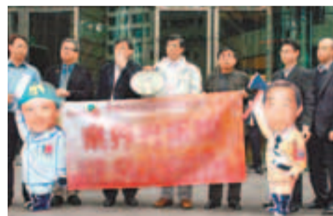
香港證券及期貨從業員工會繼續抗議加時行動。

於早習慣留在證券行「打牙較」,故對他們的影響不大,不過證券及期貨從業員工會繼續抗議行動,昨日再到港交所門口外叫反對口號。