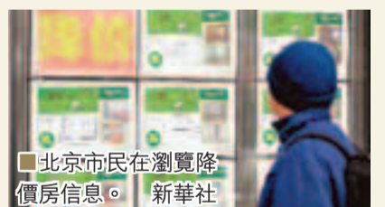
北京市民在瀏覽降價房價信息。

住證制度，為流動人口提供更好的服務。以信息共享、互聯互通為重點，加快建設國家電子政務網。大力推進政務誠信、商務誠信、社會誠信建設，構建覆蓋全社會的徵信系統。