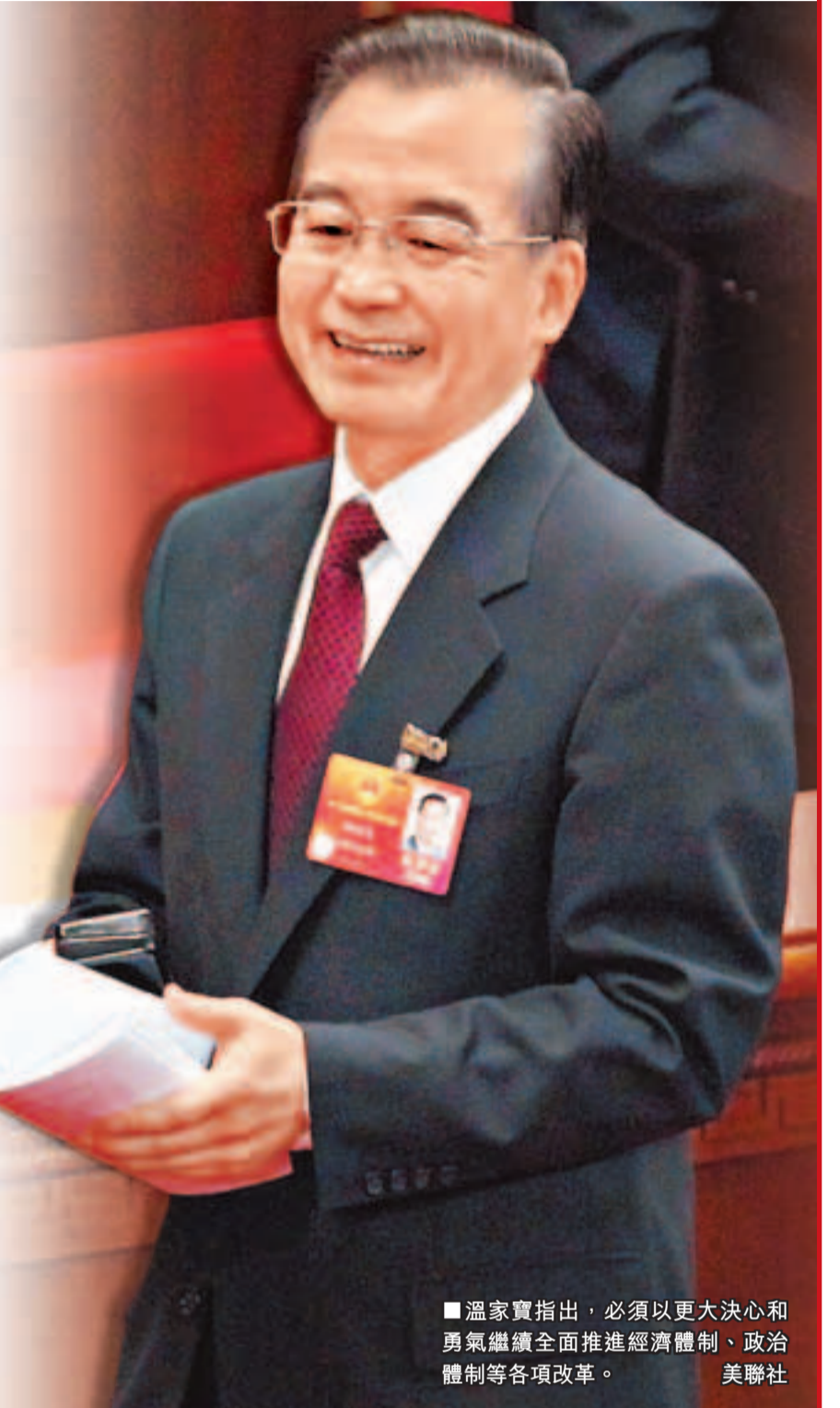
溫家寶指出，必須以更大決心和勇氣繼續全面推進經濟體制、政治體制等各項改革。