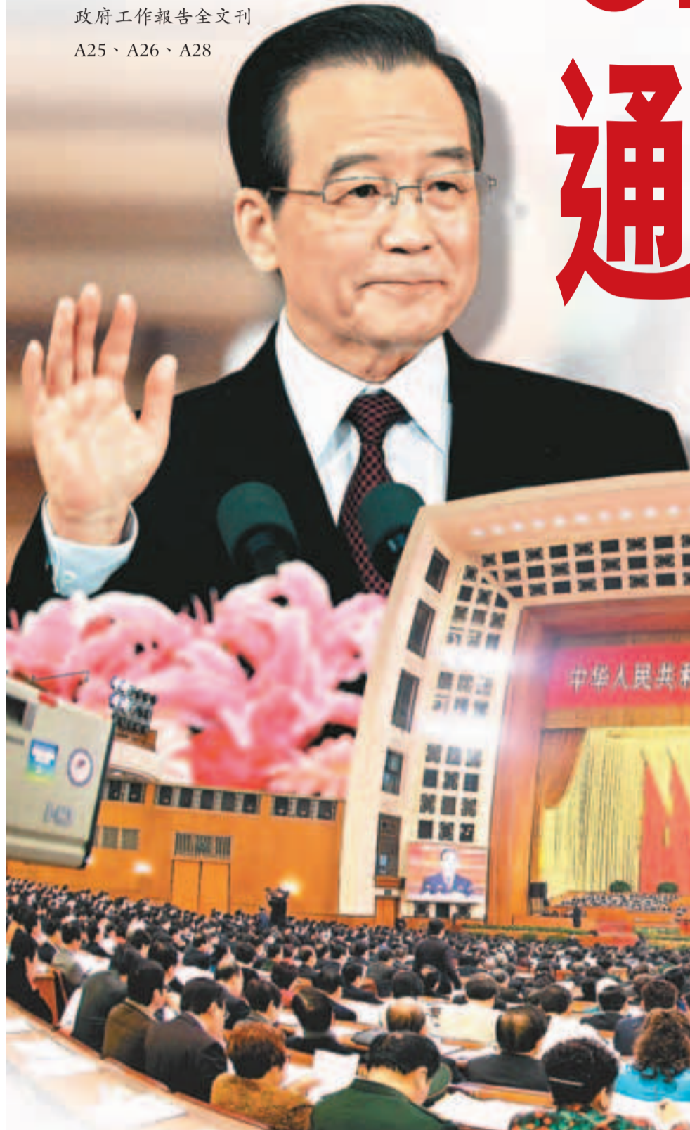
3月5日，全國人大會議在北京開幕。國務院總理溫家寶作政府工作報告。