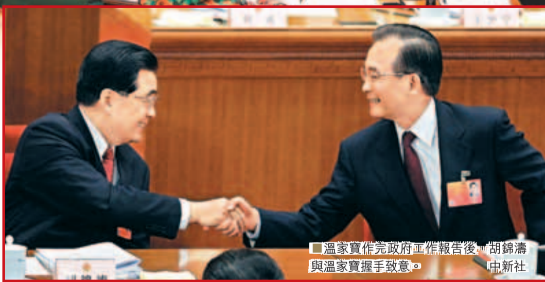
溫家寶作完政府工作報告後與胡錦濤與溫家寶握手致意。

溫家寶說，要優化財政支出結構，突出重點，更加注重向民生領域傾斜，加大對教育、文化、醫療衛生、就業、社會保障、保障性安居工程等方面的投入。更加注重加強薄弱環節，加大對「三農」、欠發達地區、科技創新和節能環保、水利、地質找礦等的支持。更加注重動員節約，嚴格控制「三公經費」，大力精簡會議和文件，深化公務用車制度改革，進一步降低行政成本。繼續控制樓堂館所建設規模和標準，壓縮大型運動會場館建設投入。全面加強對重點領域、重點部門和重點資金審計。實施結構性減稅。認真落實和完善支持小型微型企業和個體工商戶發展的各項稅收優惠政策，開展營業稅改徵增值稅試點。繼續對行政事業性收費和政府性基金進行清理、整合和規範。加強地方政