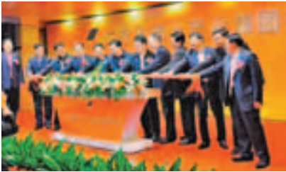
■廣東省稀土產業集團掛牌成立儀式。

香港文匯報訊（記者 古寧 廣州報道）廣東省稀土產業集團日前掛牌。廣東省委副書記、廣東省省長朱小丹出席掛牌儀式並宣佈廣東省稀土產業集團成立。據介紹，粵成立廣東省稀土產業集團後，將推進稀土礦產資源有序集約開發，打造具有國際競爭力稀土產業鏈，並加強與有關中央企業和資源地政府合作，推進稀土行業兼併重組和資源整合，大力發展稀土新材料及應用產業，力爭成為國家重點發展的三大稀土企業集團。