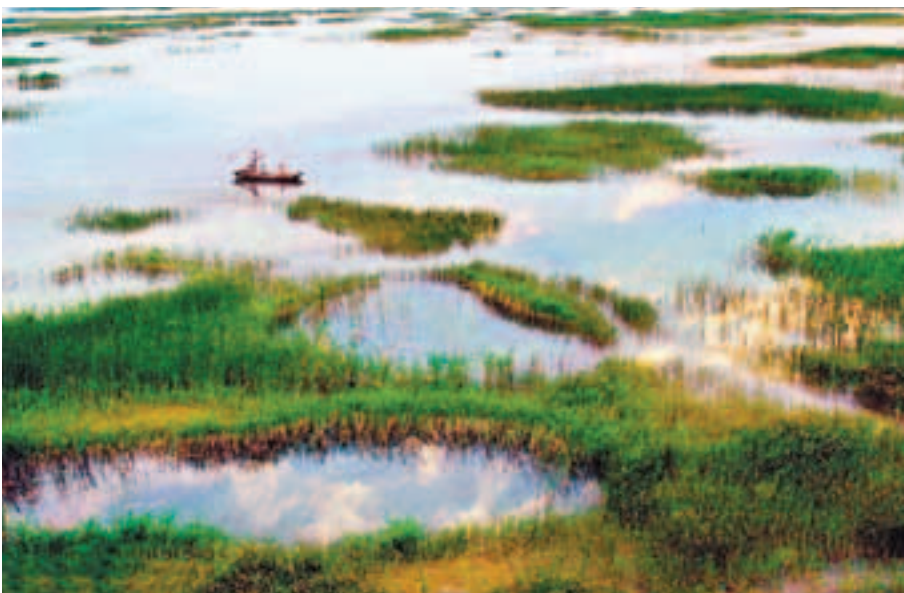
■衡水湖面積達75平方公里，衡水市持續改善衡水湖水質，又對環湖生態防護帶進行建設。

出，衡水生態湖城的建設可以聚集人氣，人氣則會帶來項目，帶來財氣，從而帶動經濟的發展。有了大工業才能擺脫「短板」，從而承接大京津，輻射冀中南。 據悉，衡水工業新區由衡水經濟開發區、桃城北方工業園區、武邑循環經濟園區三區整合，進行統一規劃佈局，現以形成現代食品、新能源、現代化工、工程橡