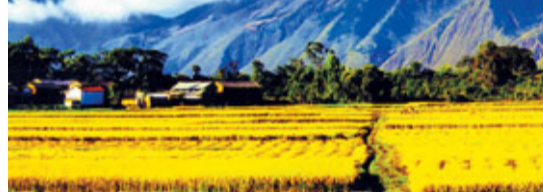
放擴張向集約高效發展轉變。

只有思維上打破舊有的框框，才能立新求發展。「城鎮上山」是雲南創新發展舉措的例證之一，正是在這樣「破而後立」的思維下，雲南先後提出「打造高原特色農產品品牌，以農業產業化推動現代化」、「促進產業向園區聚集、政策向園區傾斜、服務向園區優化」、「以滇中經濟一體化為方向，優化資源配置，促進要素重組」等一個個創新發展的舉措。