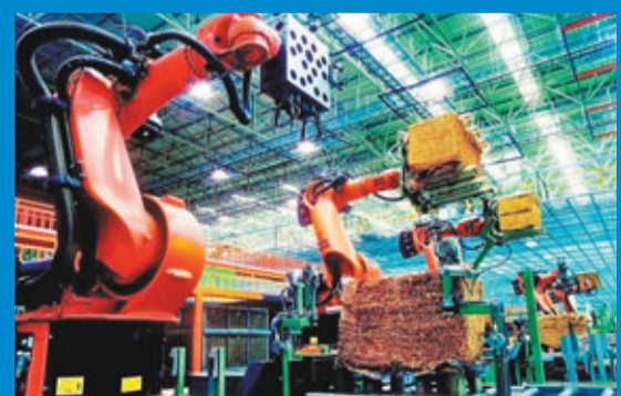
橋頭堡建設將使雲南的傳統優勢產業形成疊加效應，更將催生「裂變能量」。

雲南邊境一線的園區升級工程將緊緊圍繞「跨境經濟合作區」的規劃強力推進。圖為中越兩國正圍繞河口口岸構建的跨境經濟合作區。