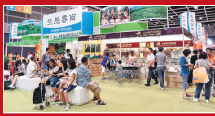
雲南正着力打造的「高原特色農產品品牌」已成為香港消費者心中的綠色、健康雲品。香港文匯報記者王晉攝