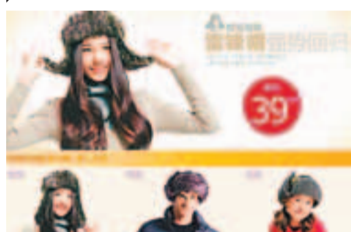
■網上熱銷的「雷鋒帽」。 網上圖片

隨著雷鋒在天安門廣場騎摩托的照片被出版界公開，這個當年喜歡拍照片，穿皮夾克還戴手錶的「潮男」雷鋒在人們心目中變得更加立體而親切了。今日是3月5日「雷鋒日」，在時尚嗅覺敏銳的年輕人中間，一股「雷鋒熱」又悄然興起：搪瓷水杯、背包等一批印有雷鋒頭像的產品頗受追捧，但這其中最「火」的還屬雷鋒帽。由於供不應求，幾家大型電子網購網站幾乎所有款式的「雷鋒帽」都打出了售罄的字樣。