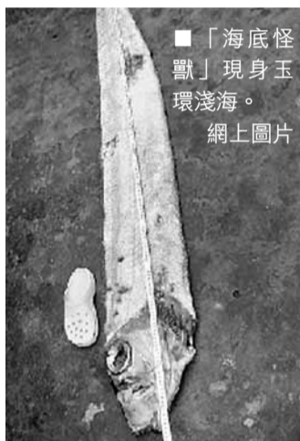
■「海底怪獸」現身玉環淺海。

3日，經過專家鑑定，最終確定這條怪魚學名叫「皇帶魚」。「這種魚一般生活在太平洋和大西洋的溫暖海域深處，水下500米以上，是世界上最長的硬骨魚。」工作人員介紹，這種魚體形碩大，又被稱為「海底怪獸」。工作人員推測，這條魚很可能是受傷了，所以被沖到了玉環淺海海域。 《錢江晚報》