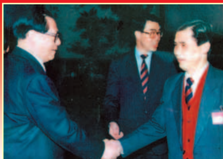
1994年劉宇新等隨團赴北京訪問，獲時任國家主席江澤民接見。