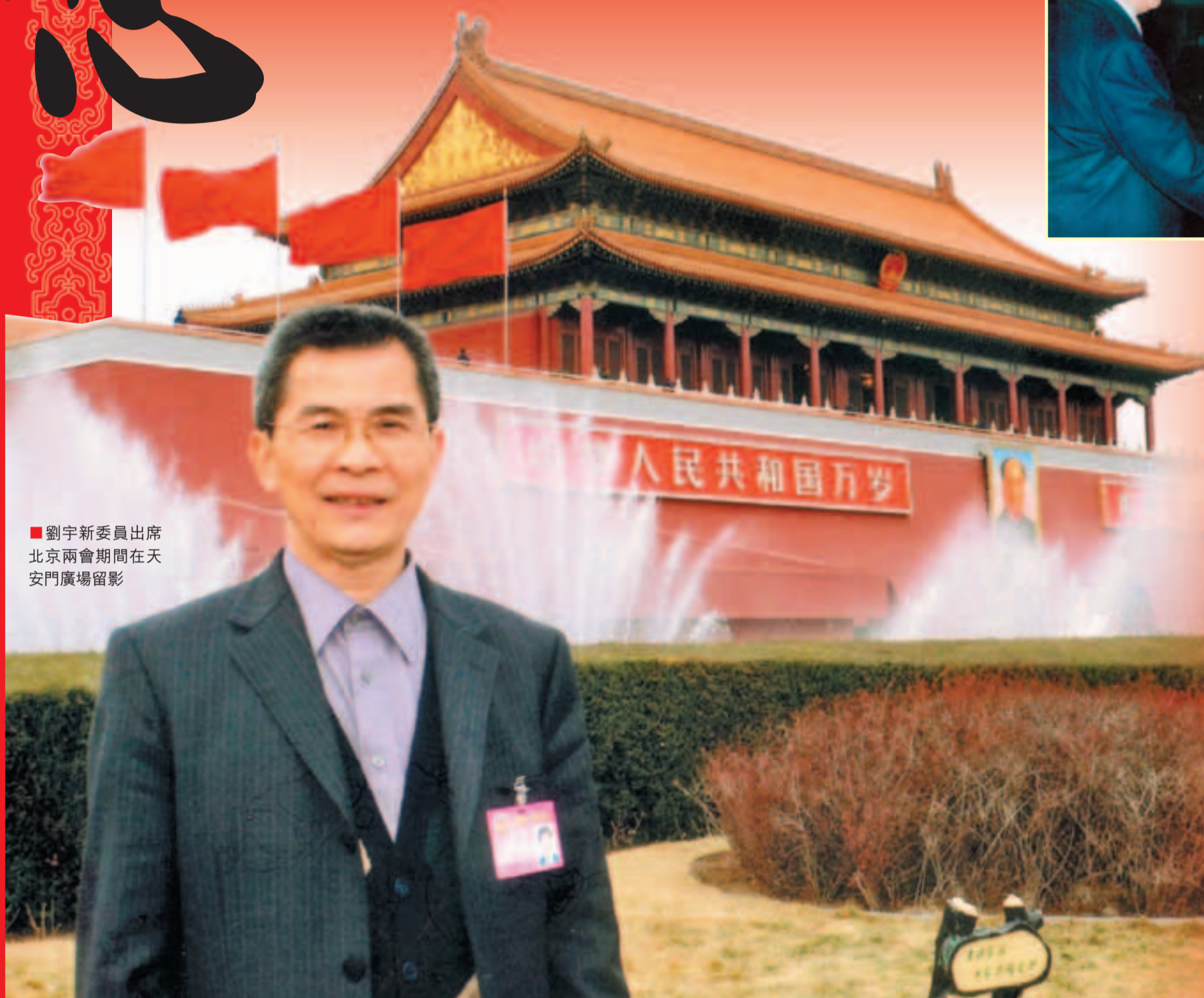
劉宇新委員出席北京兩會期間在天安門廣場合影