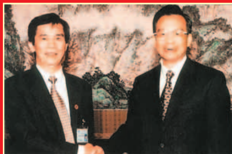
2002年劉宇新隨團赴北京訪問，獲國務院總理溫家寶接見。