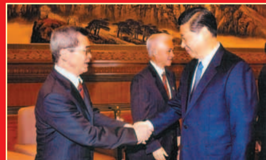
2011年11月劉宇新隨團赴北京訪問，獲國家副主席習近平接見。