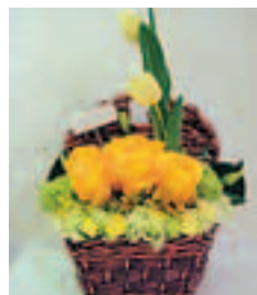
■橙色美國大玫瑰花束作品