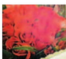
■紅色美國大玫瑰花束作品「Twelove」by Whim