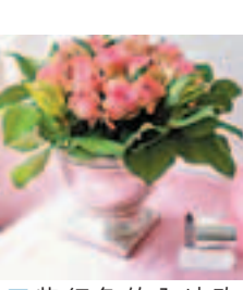
■紫紅色的內地玫瑰最合適營造復古的情懷。

玫瑰美麗但有刺，正好代表着愛情的苦與樂；它在歐洲有着源遠流長的歷史，不同貴族、皇室所栽種的玫瑰都有自己的年份和名字。隨着時間發展和品種改良，玫瑰由有刺變成極小刺，或無刺；一頭大玫瑰發展到有多頭小玫瑰等。在香港，有比較大眾化的內地玫瑰；艷麗而高檔的美國大頭玫瑰；長相有別於傳統的荷蘭玫瑰；色調柔和而浪漫的荷蘭多頭小玫瑰；及筆者最愛的厄瓜多爾大頭玫瑰，那柔和、自然、高貴和迷人的粉紅色最令人心醉！