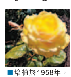
■培植於1958年，名為「Allotria」的黃玫瑰。