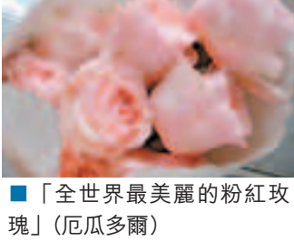
■「全世界最美麗的粉紅玫瑰」(厄瓜多爾)