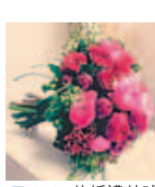
■Whim的婚禮花球作品「Ruby Symphonies」(荷蘭玫瑰)