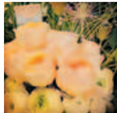
■蜜桃色荷蘭玫瑰花束作品「Neon Fairies」by Whim