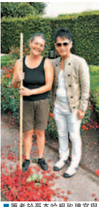
■筆者於哥本哈根玫瑰宮與園藝師交流打理玫瑰的心得。