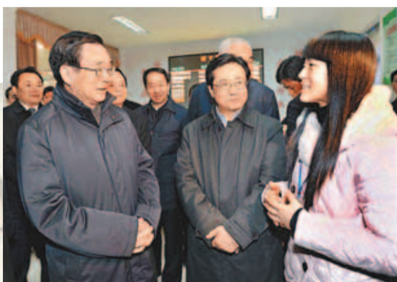
2月16日，賀國強在浙江湖州市安吉縣遞鋪鎮橫山村調研。資料圖片