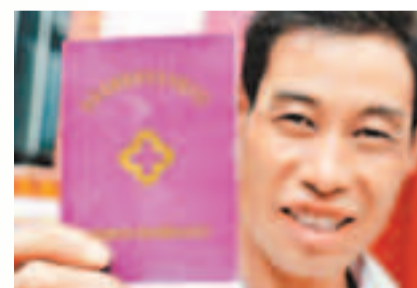
三年後政府補助農民醫保標準將提高到每人每年360元以上。資料圖片

但不少業內人士認為，藥品價格管理經歷了從全部管制到基本放開，再到逐步加強管制的過程，許多藥品在放開過程中價格大幅度上漲，藥品定價「水分多」、流通環節「雁過拔毛」，價格虛高及各環節利益分配格局已經形成，改革