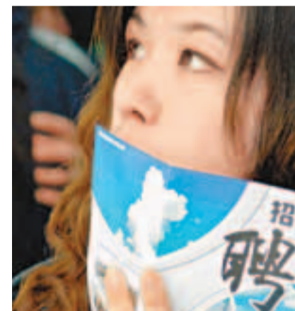
中國面臨的就業形勢更加複雜，就業總量壓力將繼續加大。資料圖片

國務院日前批轉的《促進就業規劃（2011—2015年）》指出，「十二五」時期將實施更加積極的就業政策。國家將