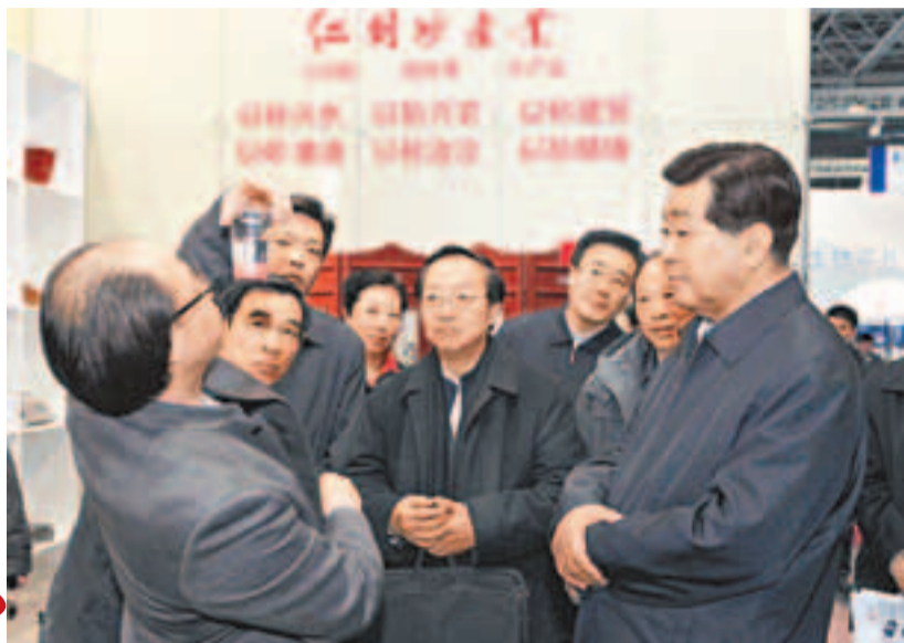
2月15日，賈慶林在北京中關村國家自主創新示範區調研。資料圖片