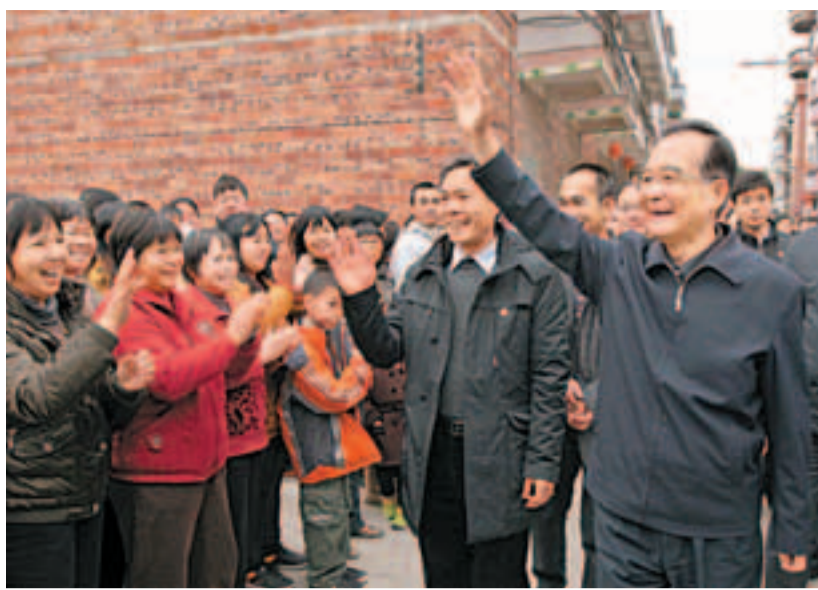
2月4日，溫家寶在廣東廣州市白雲區江高鎮水滘村調研。資料圖片