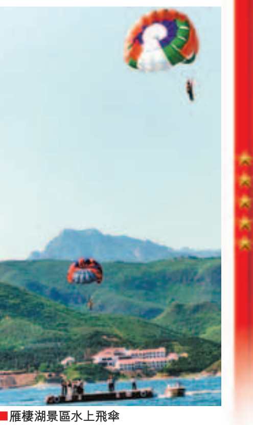
雁棲湖景區水上飛傘