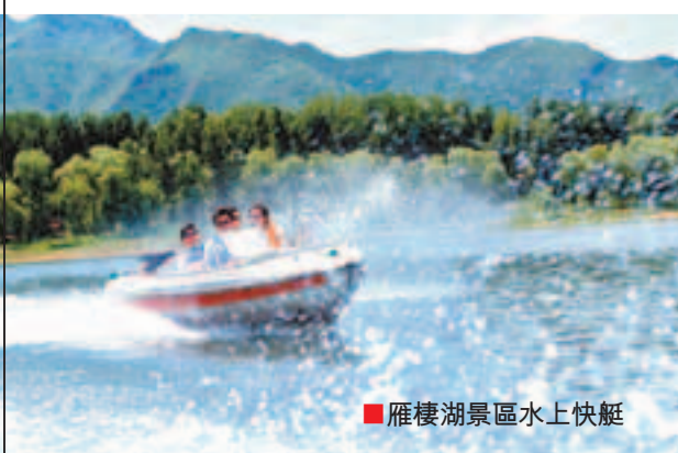
雁棲湖景區水上快艇