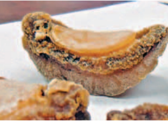
日本吉品鮑的裙邊，粒粒，疏密有致。

大隻的乾鮑，一般人家好像覺得遙不可及，反正花不起錢，也不怎麼在意它。其實，有些乾鮑如中東鮑是頗合乎經濟原則的，不妨去了解一下。首先要知道的是乾鮑的種類。