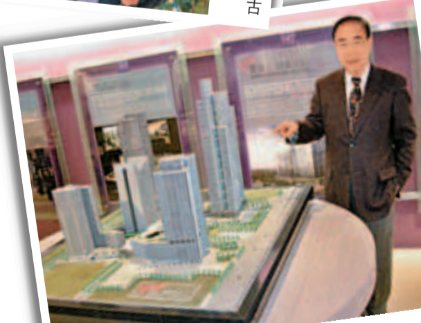
香江集團正重點計劃發展在北京之「財富中心第三期」。