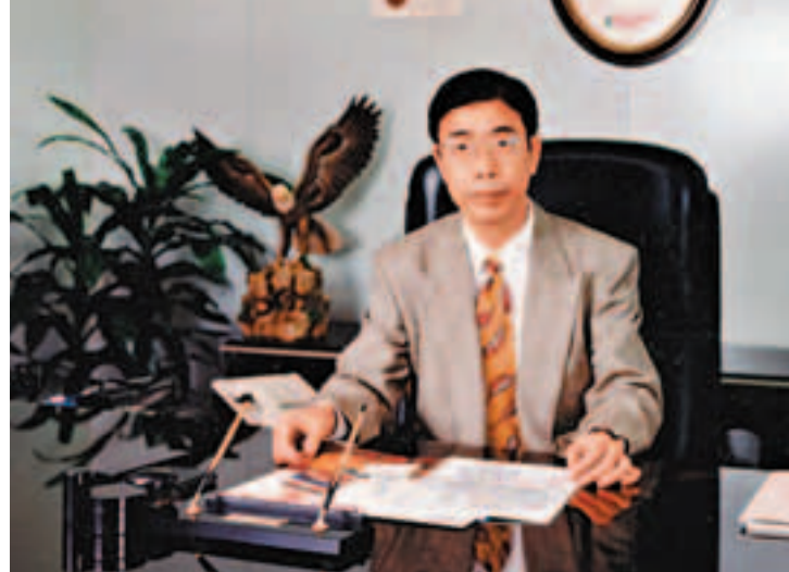
楊博士以針織服裝業奠基。

年，楊博士參與發起組織「香港協進聯盟」，支持中國政府對香港實行「一國兩制、港人治港」的方針政策。近些年，楊博士逐漸將公司生意交給年輕人打理，自己有更多時間追求，靜心回顧創業的甘苦，感悟人生。「我認為老闆和領導作貢獻工作外，其中一項便是怎樣培養接班人，有責任地物色人選繼任，因為整個社會在不斷發展，從中選擇最好的人才，為組織機構日後發展準備。培養接班人不單止是培養家族的人，只要是有能力獨當一面的，我也會盡我能力安排最合適的位置，為公司發揮所長。」楊博士說。