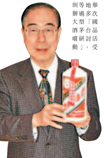
楊博士對茅台酒認識經驗豐富，並成立「國酒茅台之友協會」。

楊博士坦言，10年前大家有幸赴當地品酒、組會，從此凡宴不離茅台，國酒酒香也滿溢香港，飄向兩岸三地，成為維繫炎黃子孫，促進和平統一的最好信物。