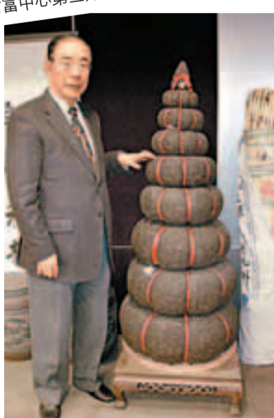
楊博士不惜攀山涉水尋覓絕世好茶。