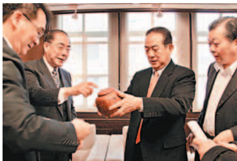
中國茶文化國際交流協會於2010年訪台灣，會長楊孫西博士向台灣親民黨主席宋楚瑜(右二)致送茶具。