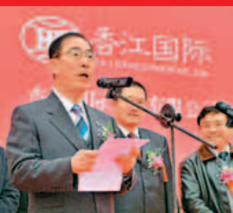
楊博士創立香江國際集團，歷任董事長至今。