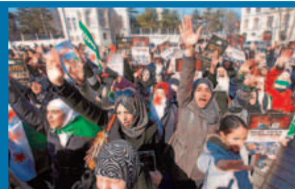
■土耳其有民眾示威抗議敘國暴力事件。