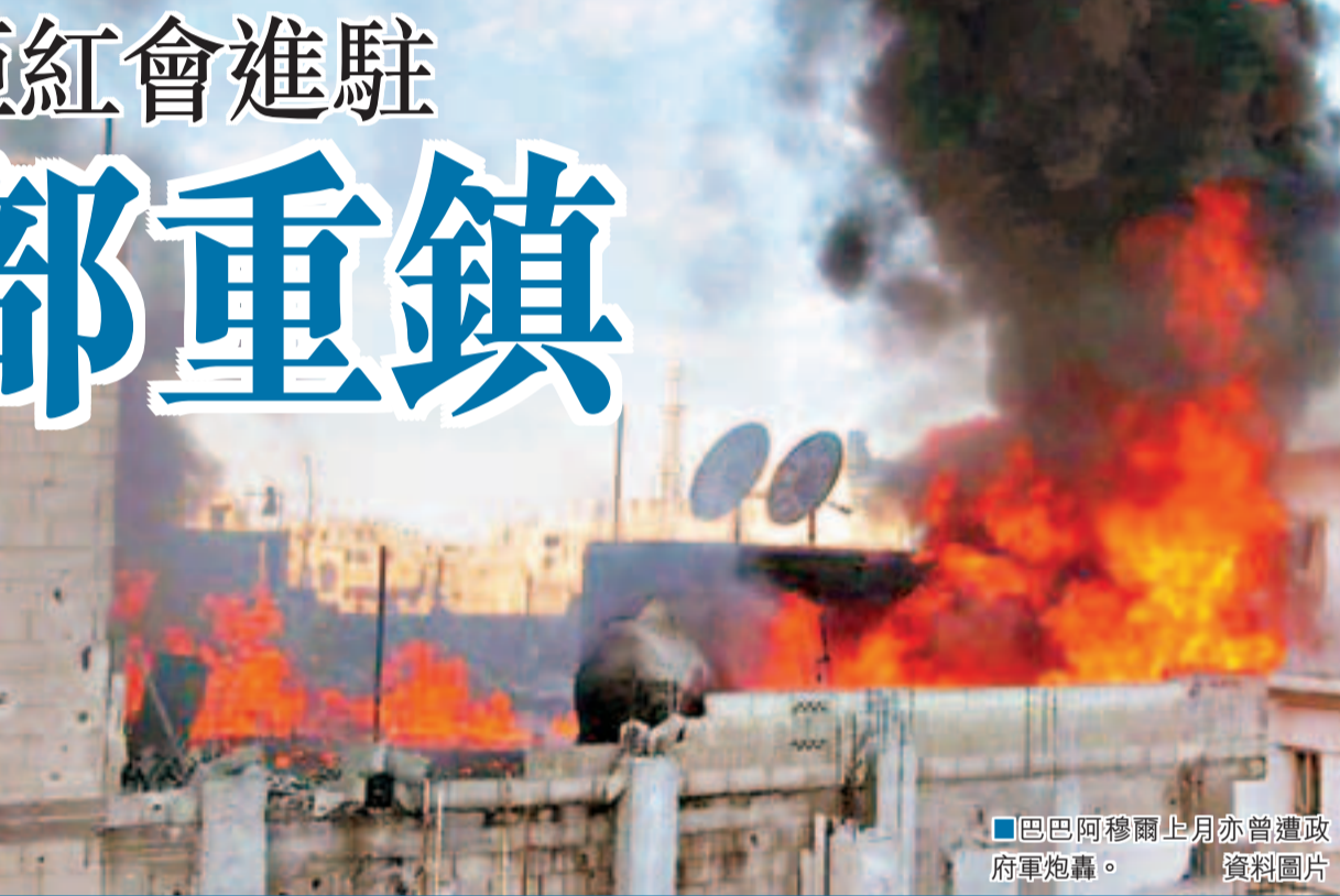
■巴巴阿穆爾上月亦曾遭政府軍炮轟。