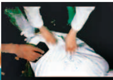
■屍袋印有女記科爾文(左圖)的名字。

片所見，一名外科醫生打扮的男子打開屍袋，展示兩名遇害記者的面部。報道稱，短片於上月27日拍攝。紅十字會昨表示，兩具屍體正運往大馬士革。