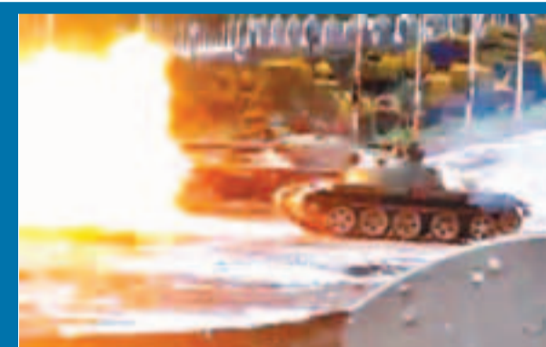
■敘軍動用坦克對付霍姆斯反對派。資料圖片