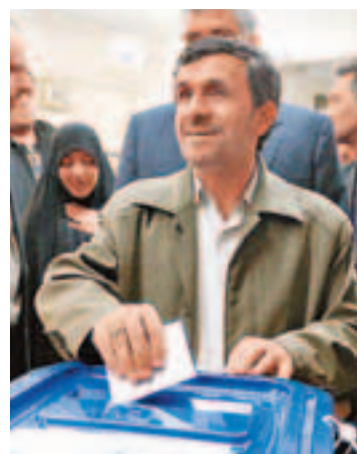
■伊朗總統內賈德參與投票。

伊朗昨日舉行國會選舉，4,800萬名選民將投票選出290個議席，最高精神領袖哈梅內伊呼籲選民踴躍參與，稱高投票率有助強化政權認受性，回應國際社會孤立伊朗。分析認為，選舉將考驗總統艾哈邁迪內賈德能否爭取保守派支持。2009年伊朗總統大選被指舞弊，觸發大規模騷亂，為免事件重演，警方稱已擬好應急方案。