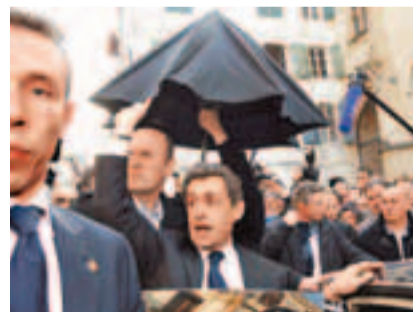
薩科齊匿酒吧後離開，由保安攙扶護駕。

尋求連任的法國總統薩科齊前日到訪屬於巴斯克地區的西南部城市貝約納拉票，遇上數百名巴斯克分離分子及社會黨支持者示威，狼狽走入一家酒吧暫避。部分人向他擲紙張，大罵「薩科齊滾蛋」，又向酒吧掙雞蛋，情況混亂。防暴警察到場驅散群眾，1小時後開傘護送薩科齊離開。 薩科齊其後譴責事件，指不能接受小部分的暴力行為。他稱，對社會黨與巴斯克分離分子扯上關係感到難過，批評他們以暴力恐嚇希望與自己見面的民眾。社會黨黨魁奧朗德亦譴責暴力行為，但稱無社會黨成員涉及事件。 最新民調顯示，社會黨候選人奧朗德在月底首輪投票有望取得28.5%選票，稍為領先薩科齊的27%。 法新社/美聯社