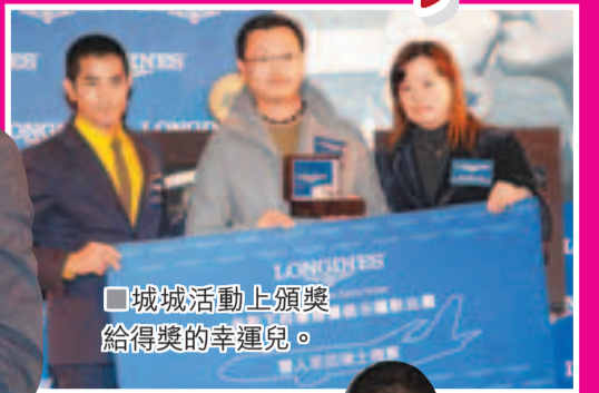
城城活動上頒獎給得獎的幸運兒。