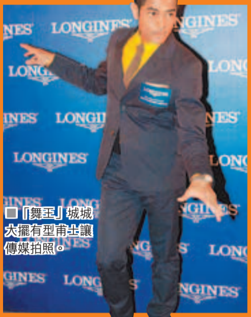
「舞王」城城大擺有型POSE讓傳媒拍照。