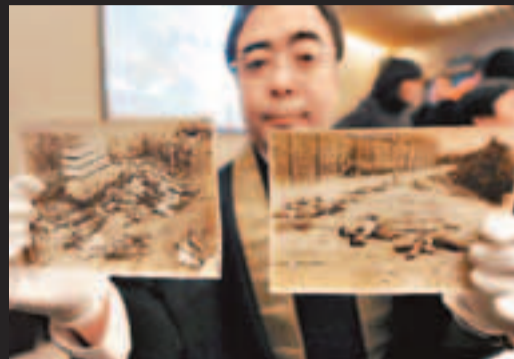
有日本人展示南京大屠殺的照片證據。