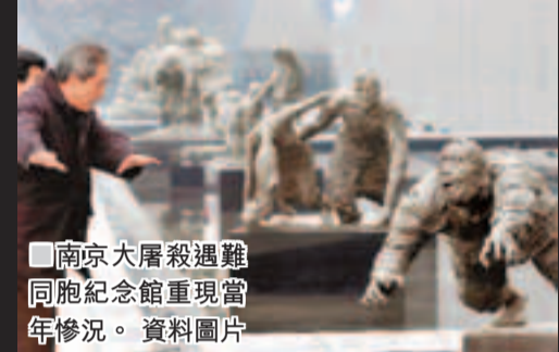
南京大屠殺遇難同胞紀念館重現當年慘況。資料圖片