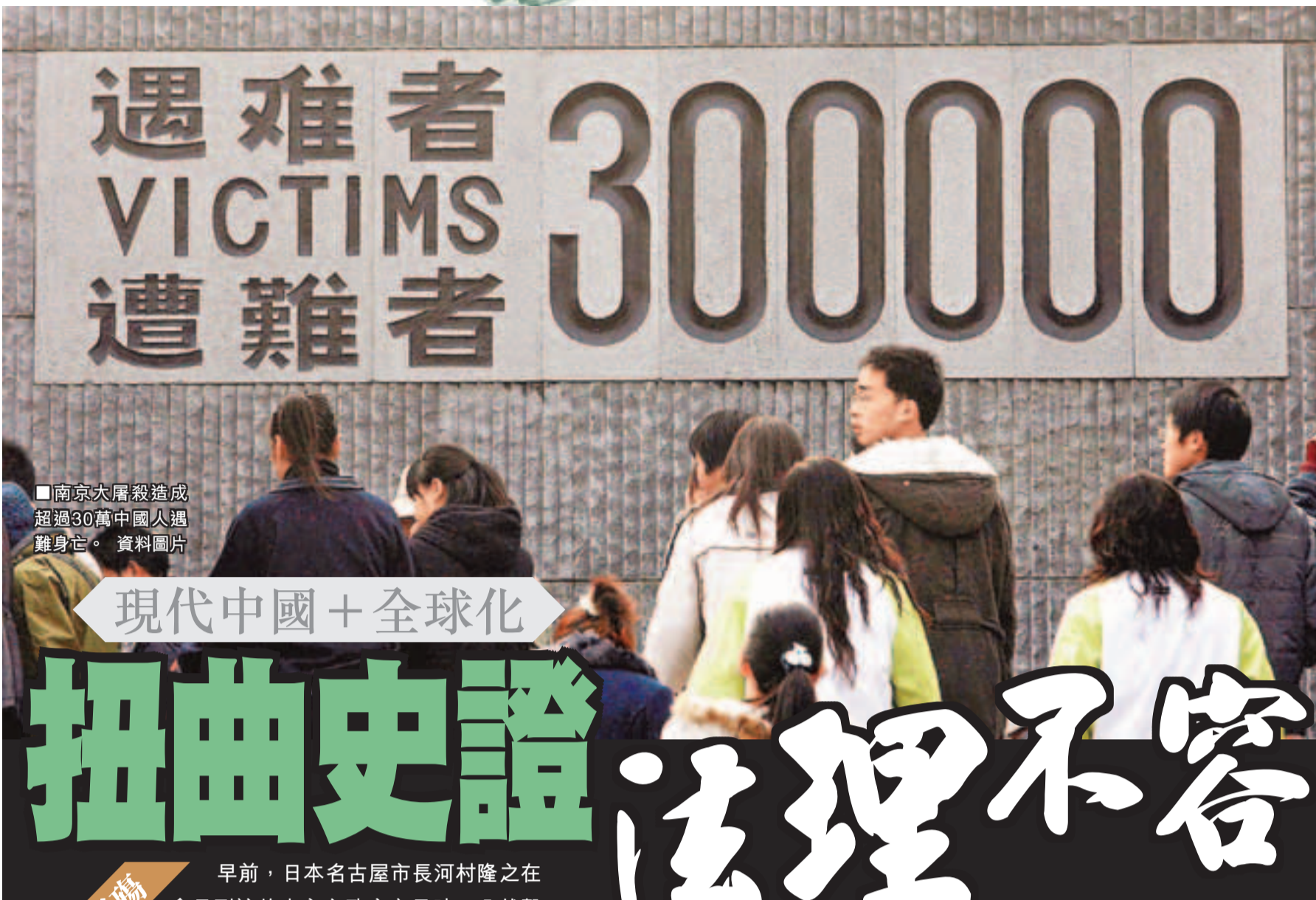
南京大屠殺造成超過30萬中國人遇難身亡。資料圖片