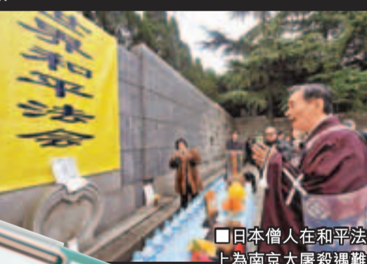
日本僧人在和平法會上為南京大屠殺遇難者唸誦經文。資料圖片

二次大戰結束之後，岡村寧次曾說：「停戰時，日方中國派遣軍的兵力，約為105萬人(華北方面軍30萬，第六方面軍35萬，第十三軍30萬，第二十三軍10萬)。」他又在回憶錄中表示：「中國派遣軍的投降，不是由於本身戰敗，而是隨著國家的投降，不得已投降的。」由此可見，如果中國軍隊暴力對待日軍，可能引起反彈，再次揭起戰爭。