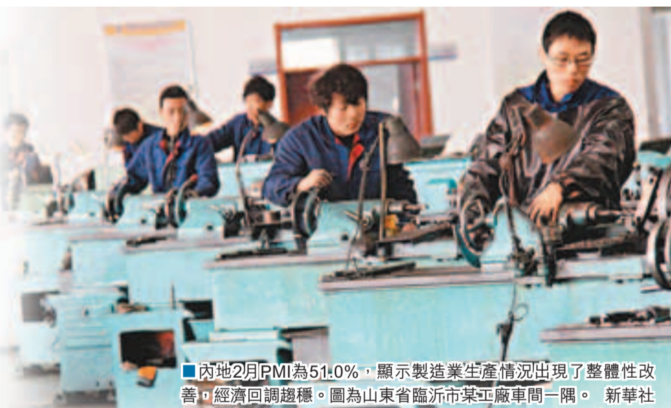
內地2月PMI為51.0%，顯示製造業生產情況出現了整體性改善，經濟回調趨穩。圖為山東省臨沂市某工廠車間一隅。

中金公司研報顯示，近期大宗商品價格的普遍上漲是購進價格指數持續走高的主要原因。由於伊朗等地