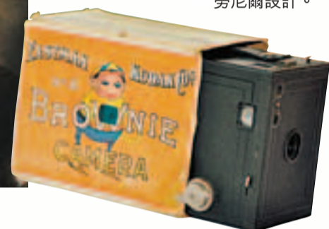
著名的「布勞尼」相機，由布勞尼爾設計。