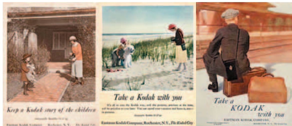
十九世紀後期至二十世紀中期的柯達宣傳海報。

大量生產的機械，兩年後成立了伊士曼乾板公司 (伊士曼柯達公司的前身)，隨後幾年柯達開始生產底片、攝影器材、X光片等。