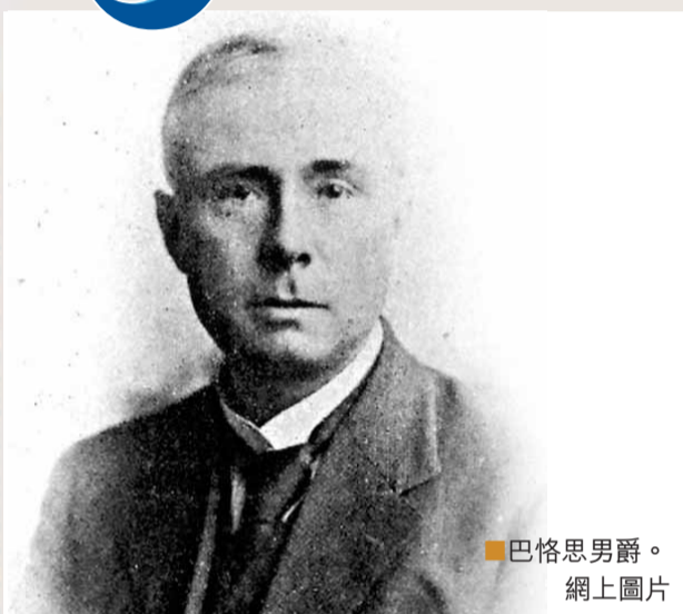
巴格思男爵。網上圖片