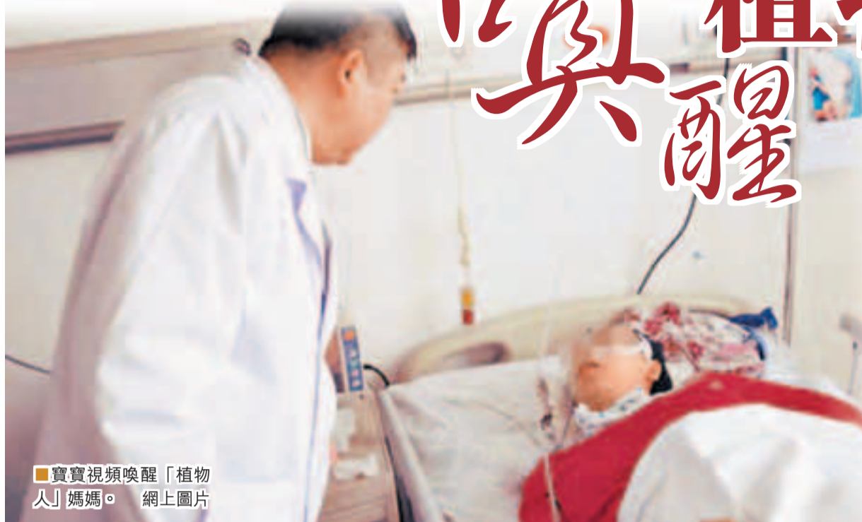
寶貴視頻喚醒「植物人」媽媽。

27日，在瀋陽醫學院奉天醫院，醫生連聲感歎：「連續創造了兩醫學奇蹟，母愛太偉大了。」