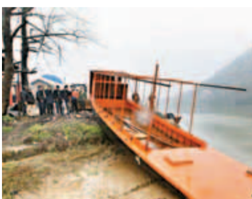
國內首艘專門為學生過渡打造的校船在耒陽市黃市鎮上堡渡口下河試水。網上圖片

該船船身總長16.6米、船寬2.6米、船高2.5米、吃水0.55米、滿載排水量12.2噸、核定載客60人。此船還將配齊消防、救生、航行信號等設備。