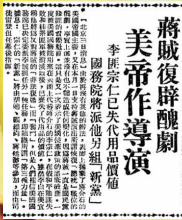
蔣賊復辟醜劇 美帝作導演