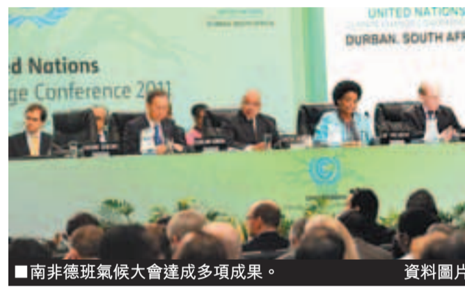
南非德班氣候大會達成多項成果。

在南非德班的聯合國氣候變化綱要公約會議上，態度一向最積極的歐盟從談判一開始就提出「有條件簽署」，要求各國在2015年前制定涵蓋主要排放國的「具有法律約束力的協議」(Legally Binding Agreement)，並於2020年實施。但與以往的氣候會議一樣，是次會議再度成為美、中、印與歐盟等排碳大國的角力場所。美國和日本等已發展國家對此協議一開始反應冷淡，並因各方分歧嚴重，導致會議延