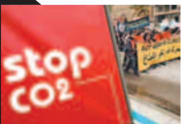
黎巴嫩有示威者要求各國停止排放二氧化碳。 資料圖片