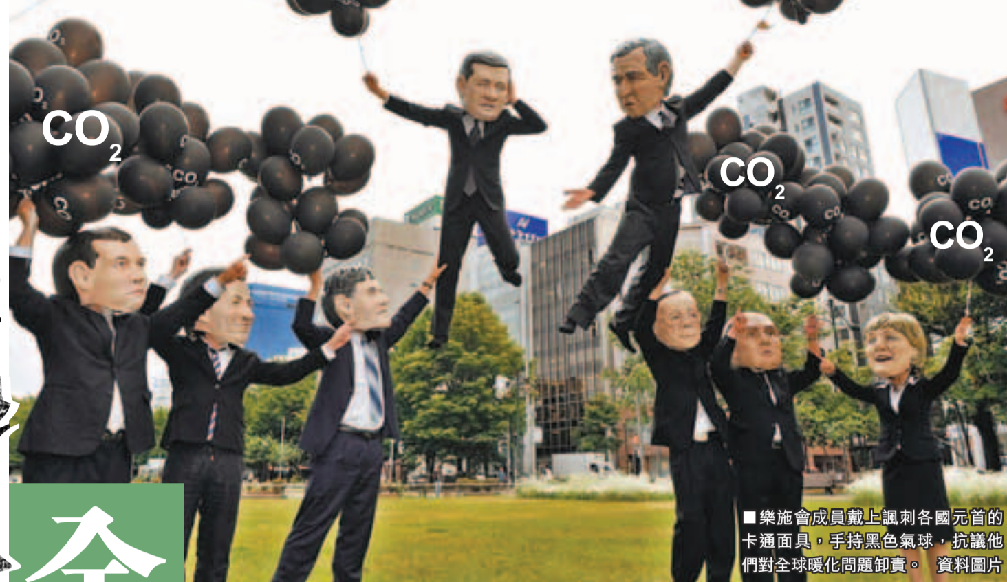
樂施會成員戴上諷刺各國元首的卡通面具，手持黑色氣球，抗議他們對全球暖化問題卸責。