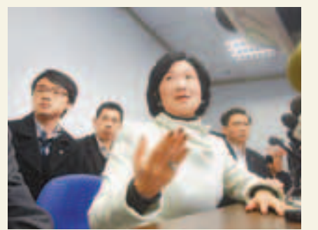
■葉劉淑儀由於提名票不足最終無法參選。

香港文匯報訊(記者 鄭治祖)宣布有意角逐的新民黨主席葉劉淑儀，昨日終在距離提名期結束前半小時宣布，由於選委提名票不足，故無法報名參與今年的特首選舉，並形容自己有「三大死因」，「無鐵票、無欽點、有口才無後台」，故最終未能成為候選人。