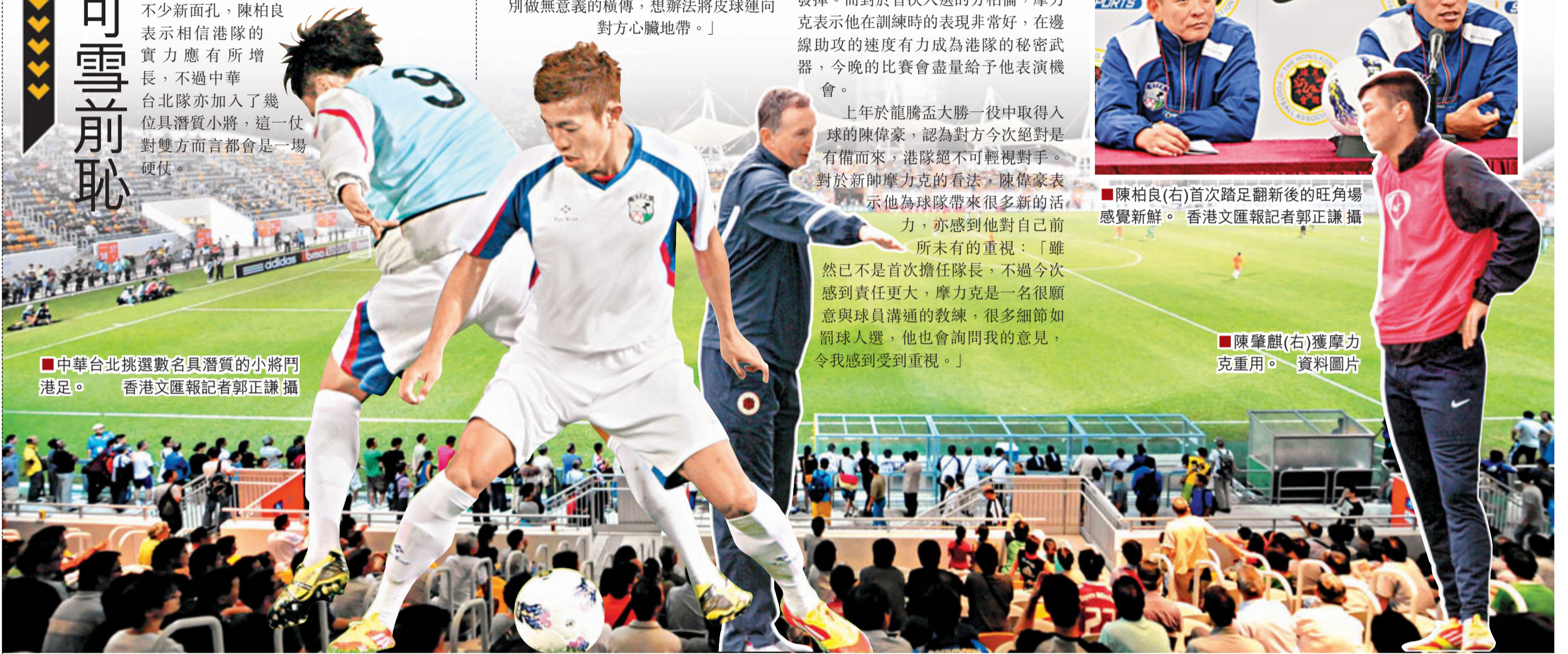
中華台北挑選數名具潛質的小將門港足。