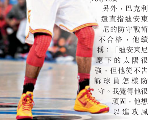
歐文與林書豪的控衛之戰甚具睇頭。資料圖片