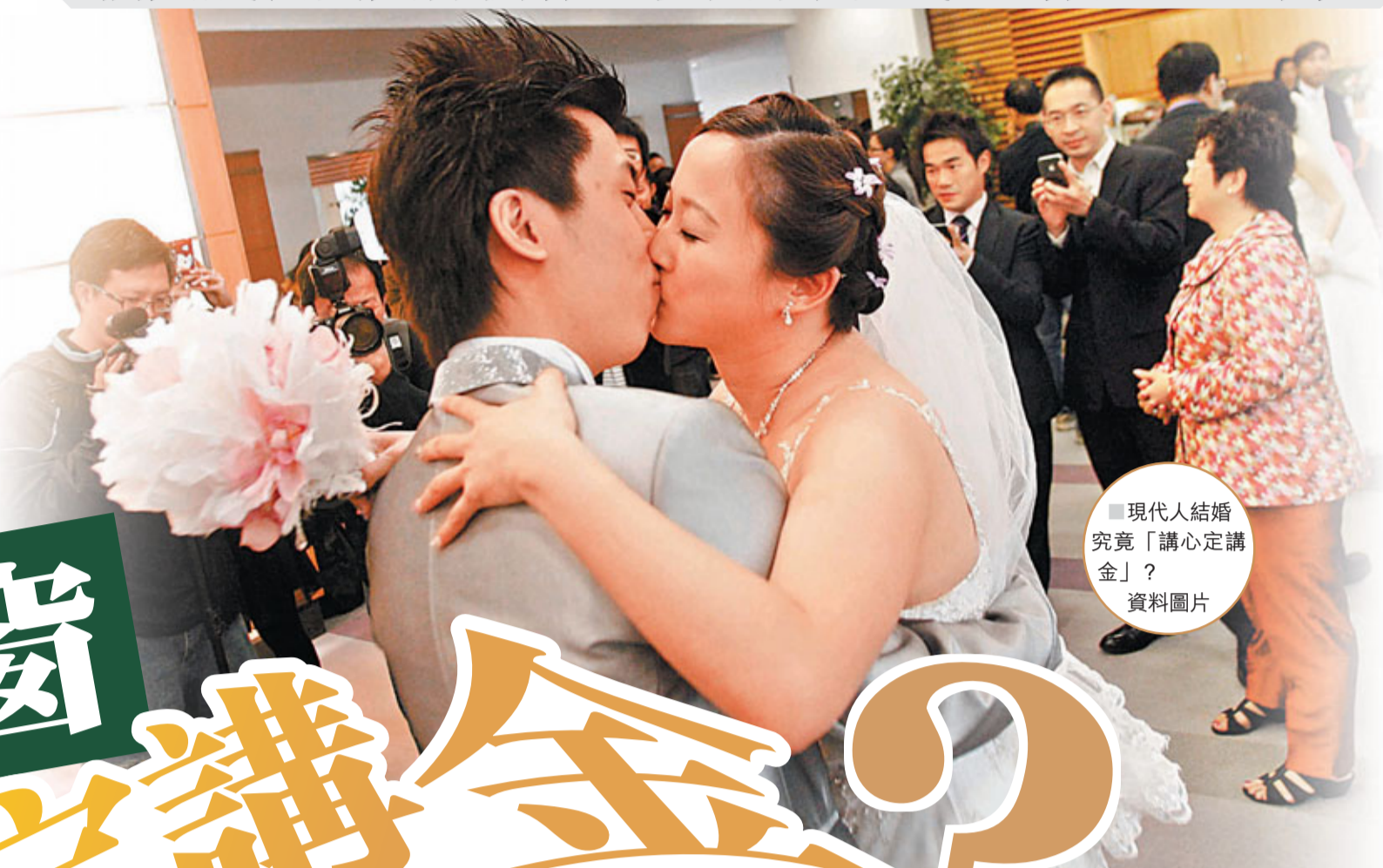
■現代人結婚究竟「講心定講金」？ 資料圖片

作者簡介 胡潔人博士 現任香港城市大學專上學院社會科學學部講師。2009年獲得香港中文大學社會學系哲學博士。中國人民大學糾紛解決研究中心成員、中國奧斯特羅姆協會(Ostrom Society)會員、香港作家協會會員。發表中英文論文數篇。