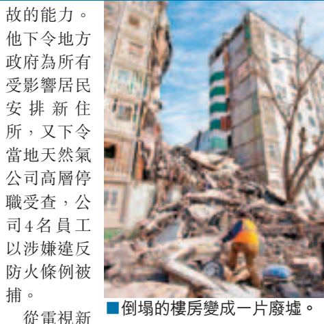
■倒塌的樓房變成一片廢墟。

俄羅斯南部城市阿斯特拉罕一棟9層高民房前日發生爆炸，其後大樓倒塌，造成9死12人傷，仍有至少兩人被埋失蹤。當局相信意外因天然氣洩漏引起，但不排除住戶引爆氣體自殺或自殺式恐怖襲擊的可能。俄羅斯總理普京昨日第一時間趕到現場視察。 拯救員到場後發現兩名居民當場死亡，之後陸續找到多名死者。俄國緊急部門派出拯救專家及機械裝置，乘坐兩架大型運輸機到場增援，又出動數百名拯救員搜救。 當局指，低層最先發生爆炸，當居民慌忙逃生時，對上6層樓倒塌。由於發生爆炸的3樓住戶有自殺傾向，曾多次打開天然氣開關企圖自殺，故是次爆炸也可能由他而起。