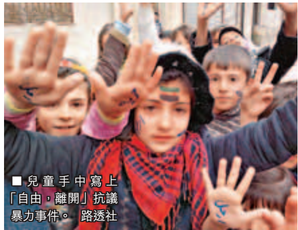
■兒童手中寫上「自由，離開」抗議暴力事件。