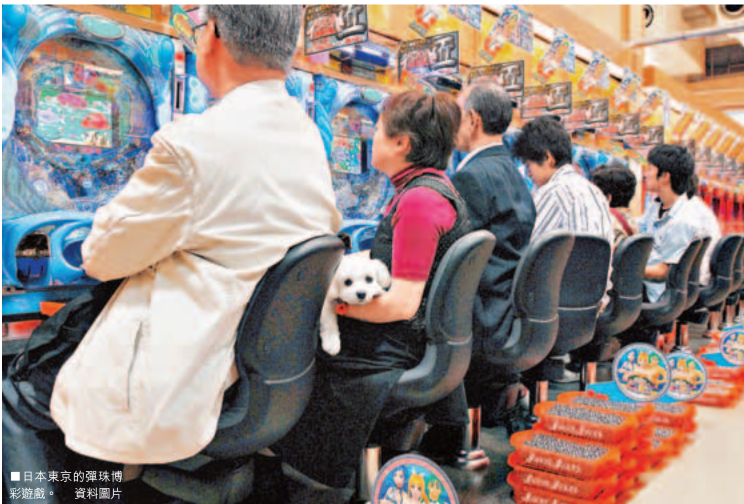
■日本東京的彈珠博彩遊戲。