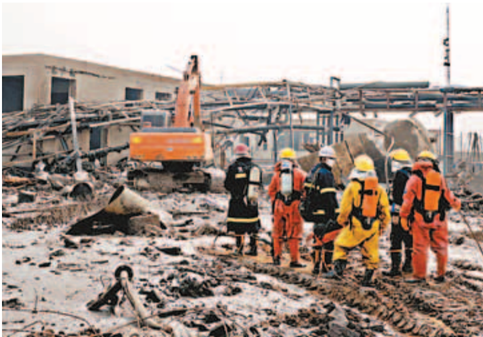
消防人員在爆炸現場進行搜救。肇事車間被夷為平地。

據了解，河北克爾化工是一家石化醫藥企業，2009年3月3日開工建設，2010年3月投產。主要生產噁二嗪、西林納、氫基乙胺酸乙酯等。 據新華社報道，有村民表示，克爾化工廠的產品屬高污染化學品，所以職工大部分為中年男性，未婚者一般不予錄用。 據當地政府部門介紹，河北克爾化工廠是一家民營企業，投產約兩年，2011年曾發生過一起火災，但並未造成人員傷亡。