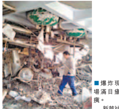
爆炸現場滿目瘡痍。