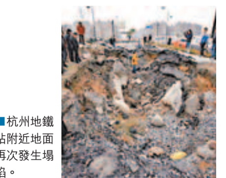
杭州地鐵站附近地面再次發生塌陷。

香港文匯報訊(記者 田甜 杭州報道) 繼2008年11月杭州地鐵蕭山段發生大面積塌陷事故之後，杭州地鐵再度陷入「塌陷門」陰影之中。27日下午，位於杭州汽車客運中心和杭州地鐵一號線客運中心站附近的地面發生了塌陷，塌陷面積約100平方米，最深處可達3米，所幸沒有人員傷亡。