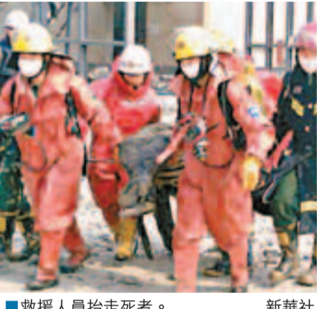
救援人員抬走死者。