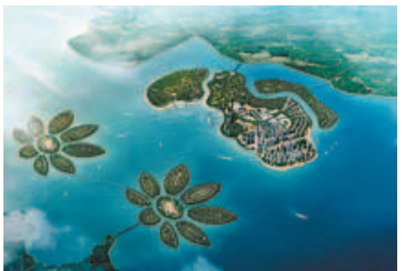
覺華島規劃效果圖。覺華島總面積13.5平方公里，是遼東灣最大島嶼，島上蒼翠掩映，號稱「北方佛島」。這裡將建成集觀光、朝聖、度假、療養、商務、美食、健身、考古、探秘於一身的觀光休閒度假勝地，北方生態海島。

項目類別： 整體開發 建設地址： 覺華島中部 建設規模及內容： 佔地面積310畝，集羣項目如五星級酒店、酒店式公寓、水上樂園、娛樂嘉年華、沙灘景觀公園等，形成以旅遊、商務為一體的綜合型五星級酒店為載體，以運動、休閒為主題的高端休閒度假綜合體。 項目分析： 覺華島是遼東灣中第一大島，旅遊資源豐富，為國家級風景名勝區、國家AAA級旅遊景區、遼寧省旅遊功能集羣區。覺華島旅遊度假區由上海世博會總