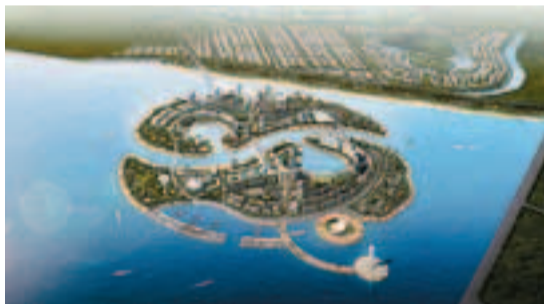
打漁山園區比翼島旅遊度假區開發項目效果圖