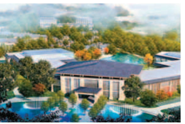
首山溫泉養生谷項目效果圖。

建設規模及內容： 規劃面積100平方公里，設4個功能區域，西部的遼寧（萬家）數字技術產業基地，重點發展以數字技術為主的高新產業；中部的東戴河新區重點發展文化、教育、商貿、地產及行政辦公；東部的高嶺工業園區重點發展先進製造業；南部沿海地區共規劃10