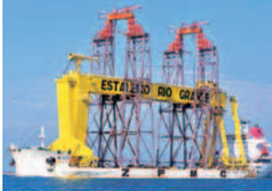
10萬噸海洋工程項目