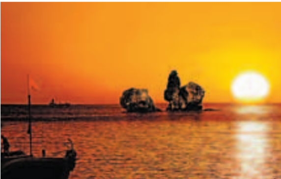
碣石日出。因秦始皇、漢武帝曾於碣石刻碑記功，魏武帝曹操更於碣石堆前留下「東臨碣石，以觀滄海」的不朽詩篇而聞名於世的綏中勝景——碣石。

項目類別： 旅遊 建設地址： 首山國家森林公園南麓 建設規模及內容： 該項目佔地面積472畝。將溫泉文化的精髓——「養生文化」作為整個旅遊度假區發展的主題，定位為中國一流的溫泉養生度假區。主要建設首山度假養生谷，包括美泉灣（濱湖國際溫泉SPA養生區）、溫泉商業街、半山溫泉酒店（五星級生態度假酒店）、香泉谷（大型露天真山水森林溫泉）、山地運動公園、四季植物園、度假別墅區、旅遊度假酒店式公寓等。本項目圍繞養生度假主題，充分發揮溫泉水的功