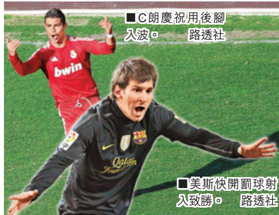
C朗慶祝用後腳入波。