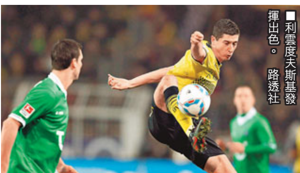
利雲度夫斯基發揮出色。

新華社柏林26日電 26日的德甲賽場以兩場重頭戲結束了第23輪的爭奪。拜仁慕尼黑2:0力克排名第4的史浩克04，重回積分榜次席，但與同樣贏球的「領頭羊」多蒙特仍有4分差距，後者以3:1完勝漢諾威。多蒙特本場得勝離不開新星利雲度夫斯基的出色發揮，這名波蘭前鋒上下半場各入一球，本賽季已斬獲16個聯賽入球，與並列「射手王」的拜仁高美斯和史浩克04的亨特拉爾只有兩球差距。「我們表現很好，要怪只能怪沒有早點讓比賽失去懸念。」多蒙特主帥高洛普有些「囂張」。