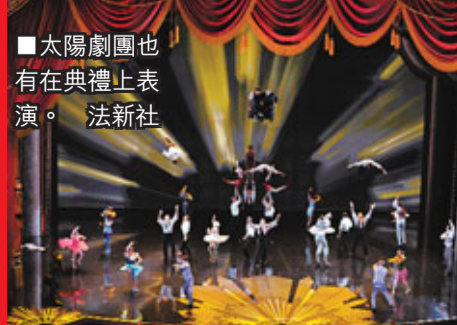
太陽劇團也有在典禮上表演。