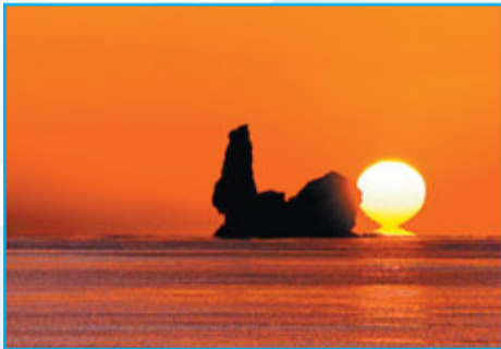
■碣石日出。因秦始皇、漢武帝都曾於碣石刻碑記功，魏武帝曹操更於碣石堆前留下「東臨碣石，以觀滄海」的不朽詩篇而聞名於世的級中勝景——碣石。