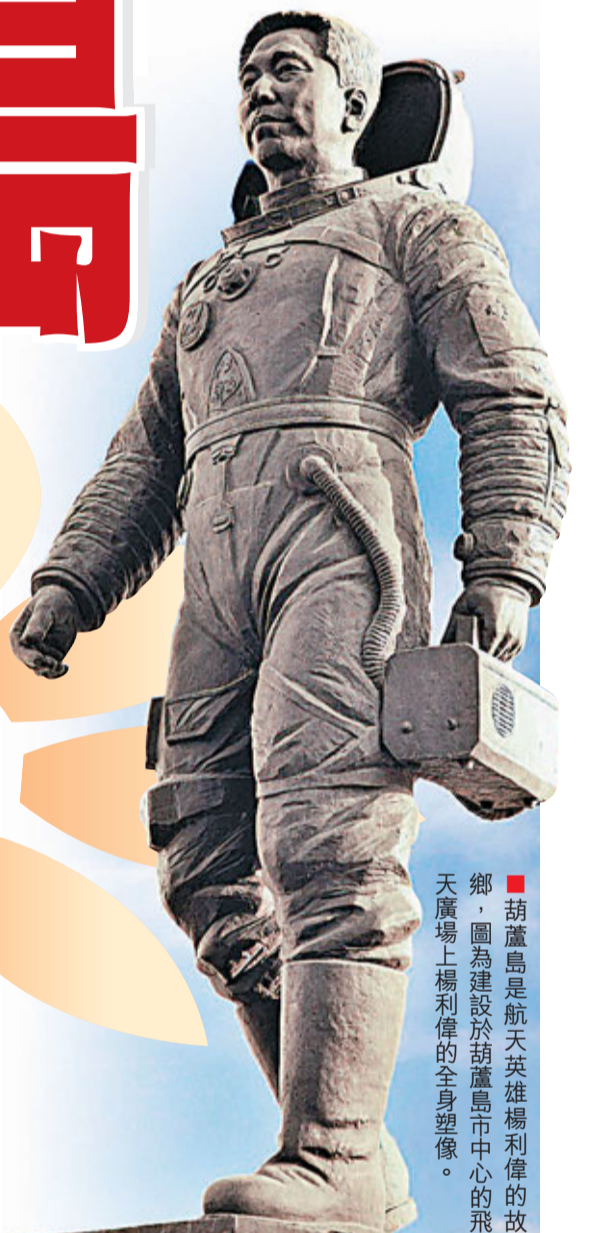
■葫蘆島是航天英雄楊利偉的故鄉，圖為建設於葫蘆島市中心的飛天廣場上楊利偉的全身塑像。

此次葫蘆島市市長都本偉率隊訪港重點尋服務業對港合作。覺華島休閒度假綜合體、遼寧東戴河新城開發、首山溫泉養生谷、東城經濟區城市綜合體等項目誠邀港商合作。