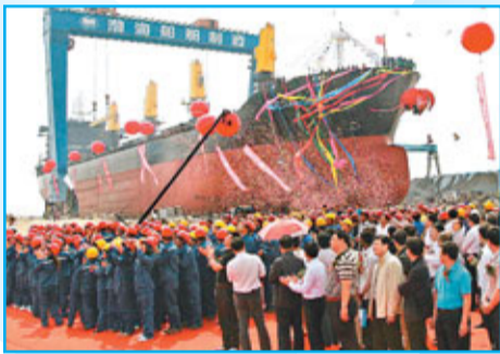
■葫蘆島是中國重要的造船基地。