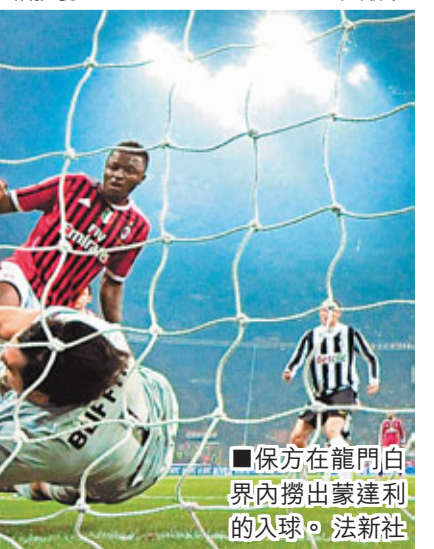
保方在龍門白界內撈出蒙達利的入球。